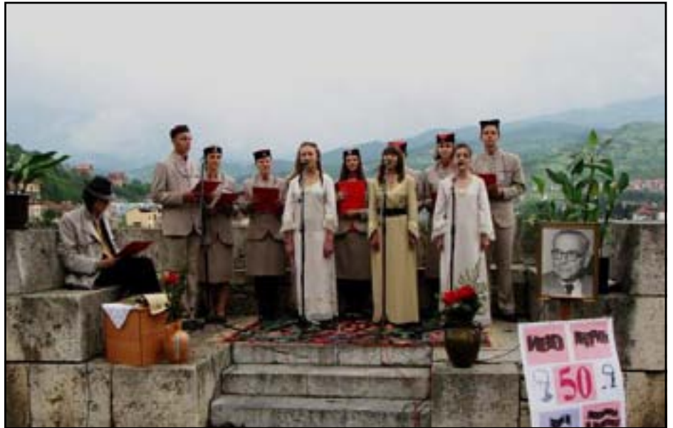
Вишеградска стаза - реципал на Ђурији

Радио Вишеград припрема програм у простору који не задовољава услове рада ове информативне куће. Поред пре-