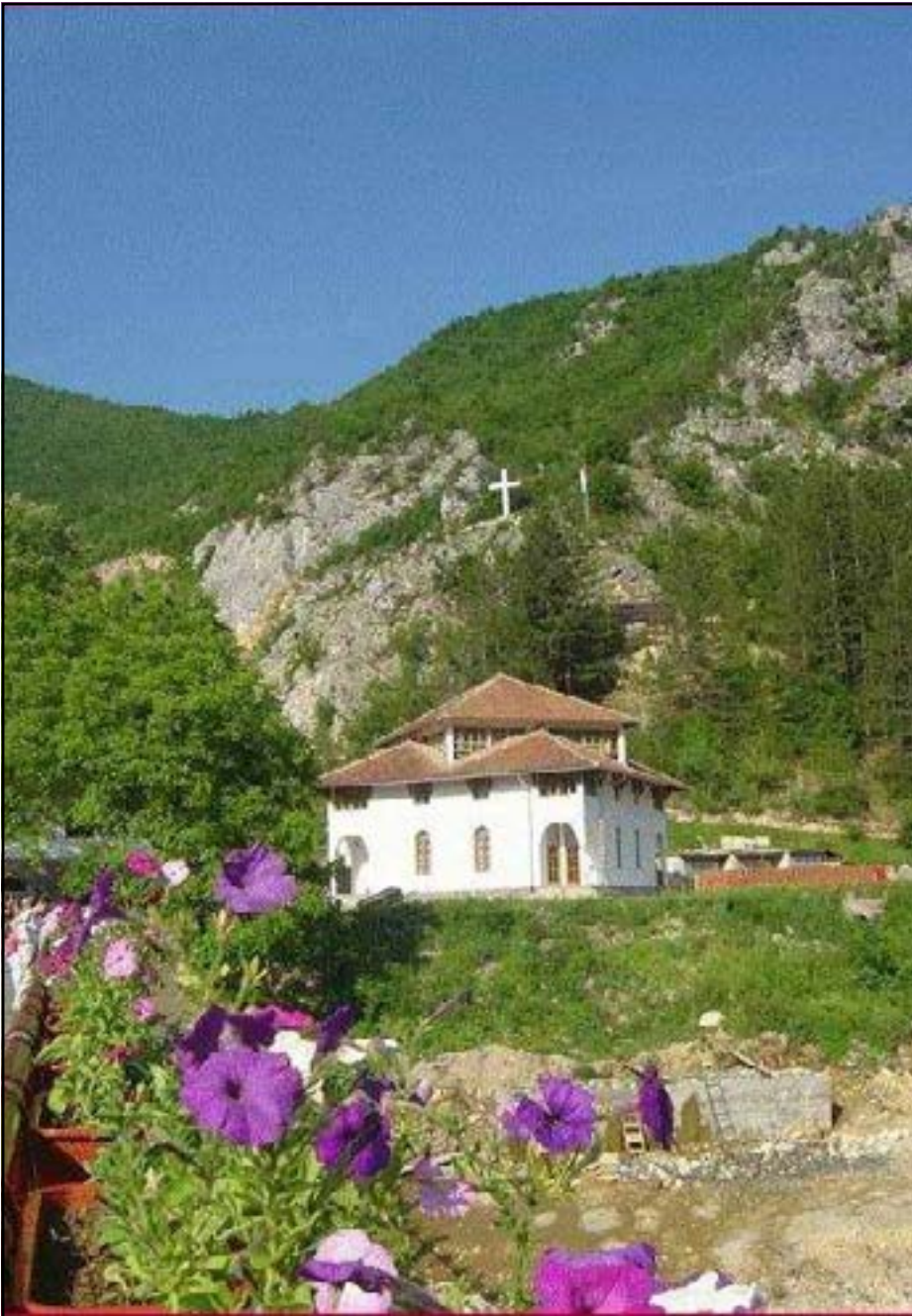
Манастир Добрун, поглед с брда

електране на Дрини” - Вишеград, које послује у оквиру мјешовитог холдинга “Електропривреда Републике Српске”.