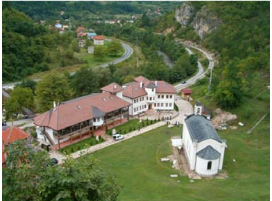
Манасџир Добрун из XIV вијека

Постојећи значајни инвеститори/ индустријски капацитети