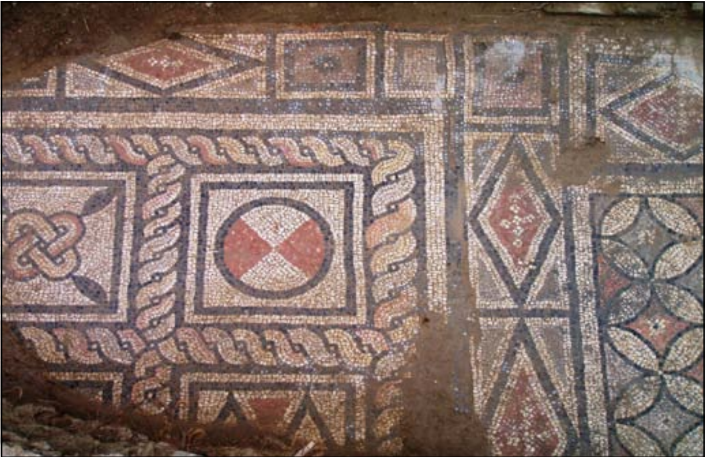
Подни мозаик царске палате

ликом некрополом и сакупио 80 римских каменних споменика. Велика поплава Дрине затрпала је те споменике, који су поново пронађени у археолошком истраживању 2008. године.