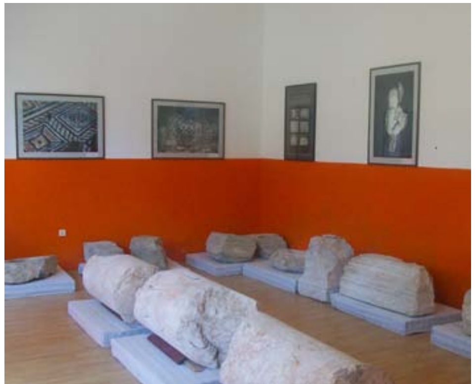
Пронађени сџоменици су привремено смјештени у згради школе у Црвици

Одавно је познато да на подручју Сребренице и Склани постоје остаци римске архитектуре. На овом подручју су при извођењу разних земљаних радова често пронађени разни керамички предмети, дијелови камених скулптура и бордура исклесаних у камену, као и других остатака, и металних новчића из римског доба. О томе постоје и записи аустроугарског министра финансија Карла Пача, који је прије 115 година, као заљубљеник у археологију вршио истраживања и ископавања на овој територији. Своје резултате објавио је у археолошкој студији под насловом "Из римске вароши у Скланима". Истражио је двије касноантичке базилике са ве-