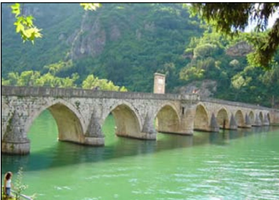
Мост Мехмед-паше Соколовића је 2007. године сављен на лисћу Унеска

У клубовима је ангажовано око 650 спортиста, а најмасовнији клубови су: кошаркашки клуб "Варда-ХЕ", фудбалски