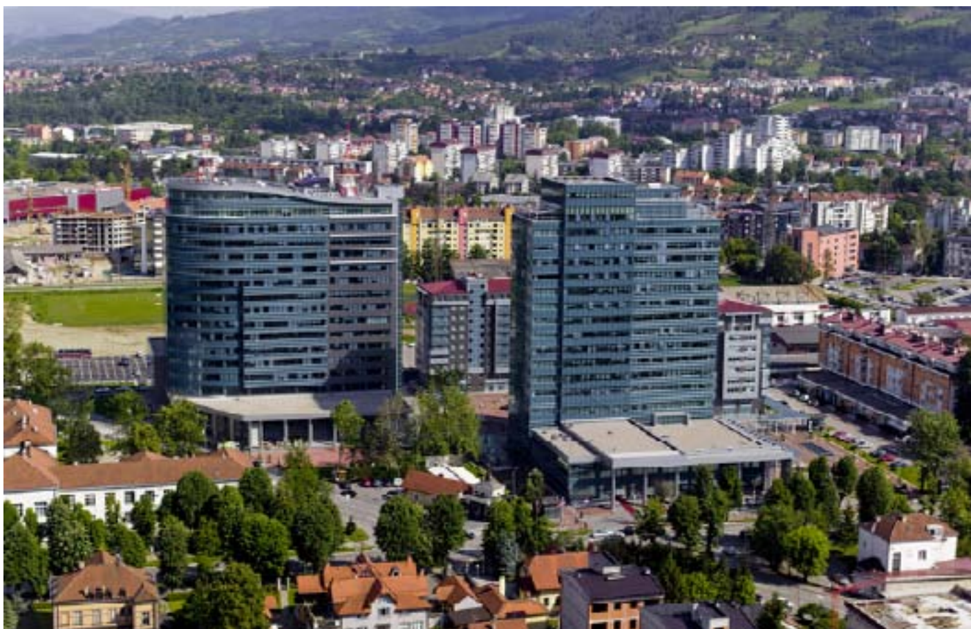
Инвестициона конференција 2011. ће бити одржана у Бањалуци и на Козари

свијету, сектор енергетике је посебно привлачан за иностране партнере, а РС, рецимо, још увијек користи свега 30 процената својих хидроенергетских потенцијала. Развој мреже мини хидроелектрана и обновљивих извора енергије уопште, те унапређење енергетске ефикасности прави су изазов за инопартнере.