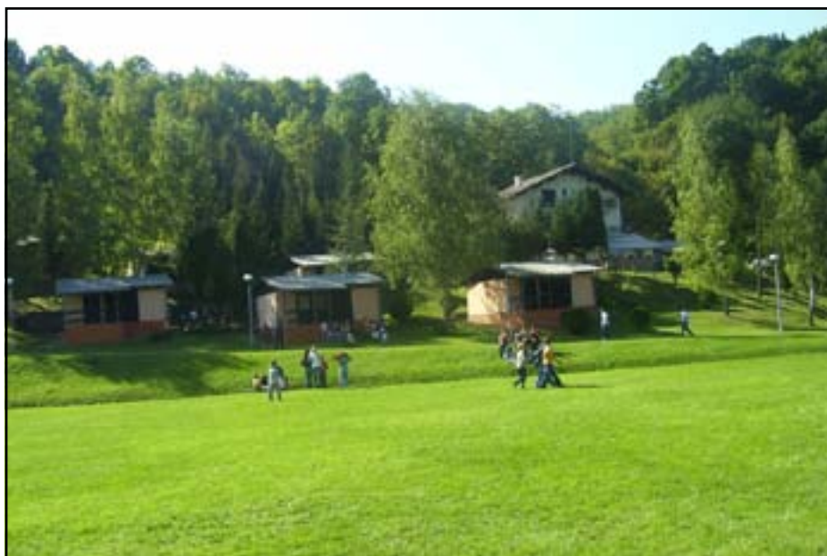
Спортско-рекреативни центар Ријечани

Традиционално, спорт у Модричи је веома развијен, а најтрофејнији спорт је свакако одбојка. У општини дјелују