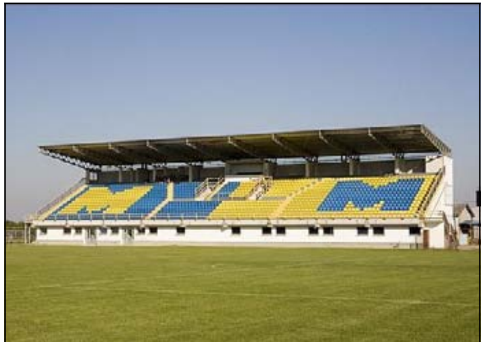
Стадион "Др Милан Јелић"

ни главни водови електро и телекомуникационе мреже, као и водовода и канализације, те је поједине парцеле лако прикључити на постојеће мреже.