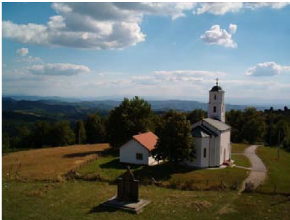
Манастир Светог Лазара и светих српских новомученика

Стари град са својом Добор кулом представља симбол Модриче. Саградио га је Иваниш Хорват 1387-1388. као