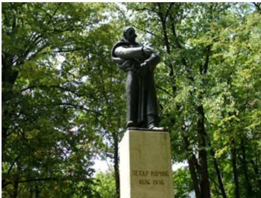
Споменик Петру Кочићу