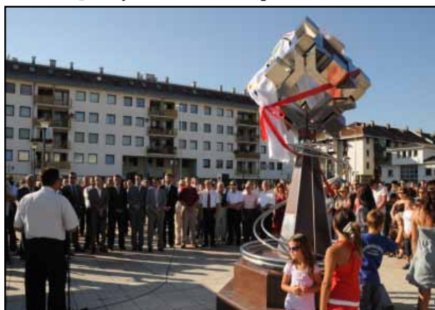
Свечано ошварање „Олимпијској парка“

Све то, као и чињеница да су Пале отворен град и град младости, који је као такав препознао и Европски покрет у БиХ, представља добру позивницу, како за посјетиоце и туристе, тако и за инвеститоре, који улагањем на овом подручју једноставно не могу учинити погрешан пословни