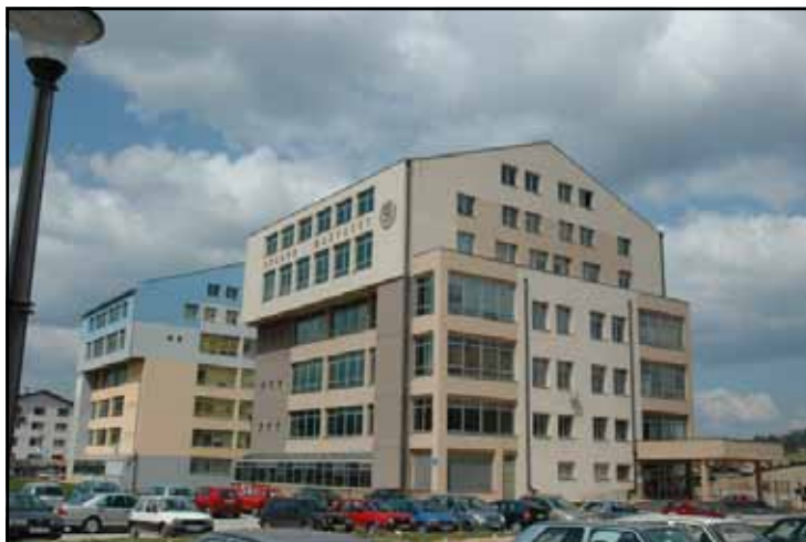
Правни и Филозофски факултет

Природне вриједности Јахорине су изузетно добро валоризоване захваљујући развоју туризма, посебно зимског. Изграђени су смјештајни капацитети, око 4.000 лежаја, скијашке стазе дужине од 20 км, са површином од 82,5 ха, жичаре и ски лифтови дужине 10.000 м, саобраћајна и друга пратећа инфраструктура. Почетком 2010. године у рад су пуштене двије шестосједе жичаре, а на освјетљеној стази организује