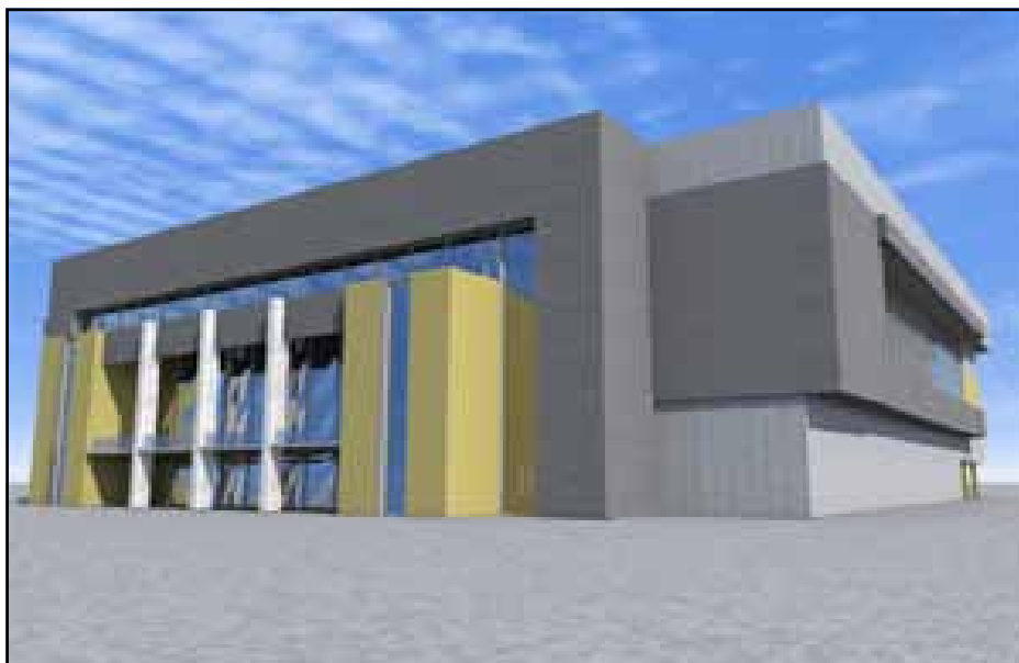
Макета будуће споршке дворане

Највећи дио општине заузимају шуме и шумско земљиште 33.721 ха или 68,5