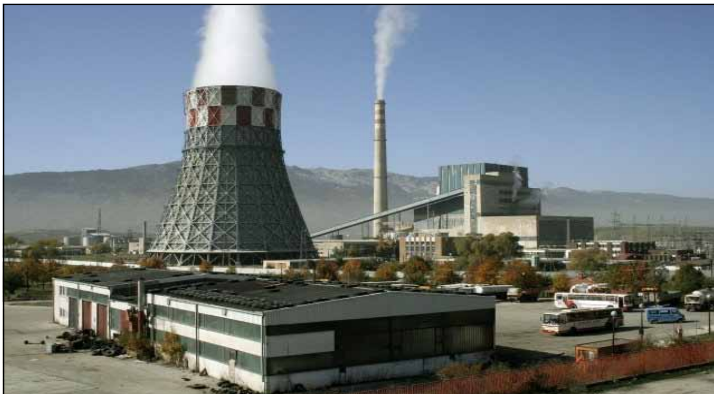
Панорама Рудника и Термоелектране Гацко

зерве чистог угља у западном експлоатационом пољу које је захваћено експлоатацијом износиле су 44.000.000 т.