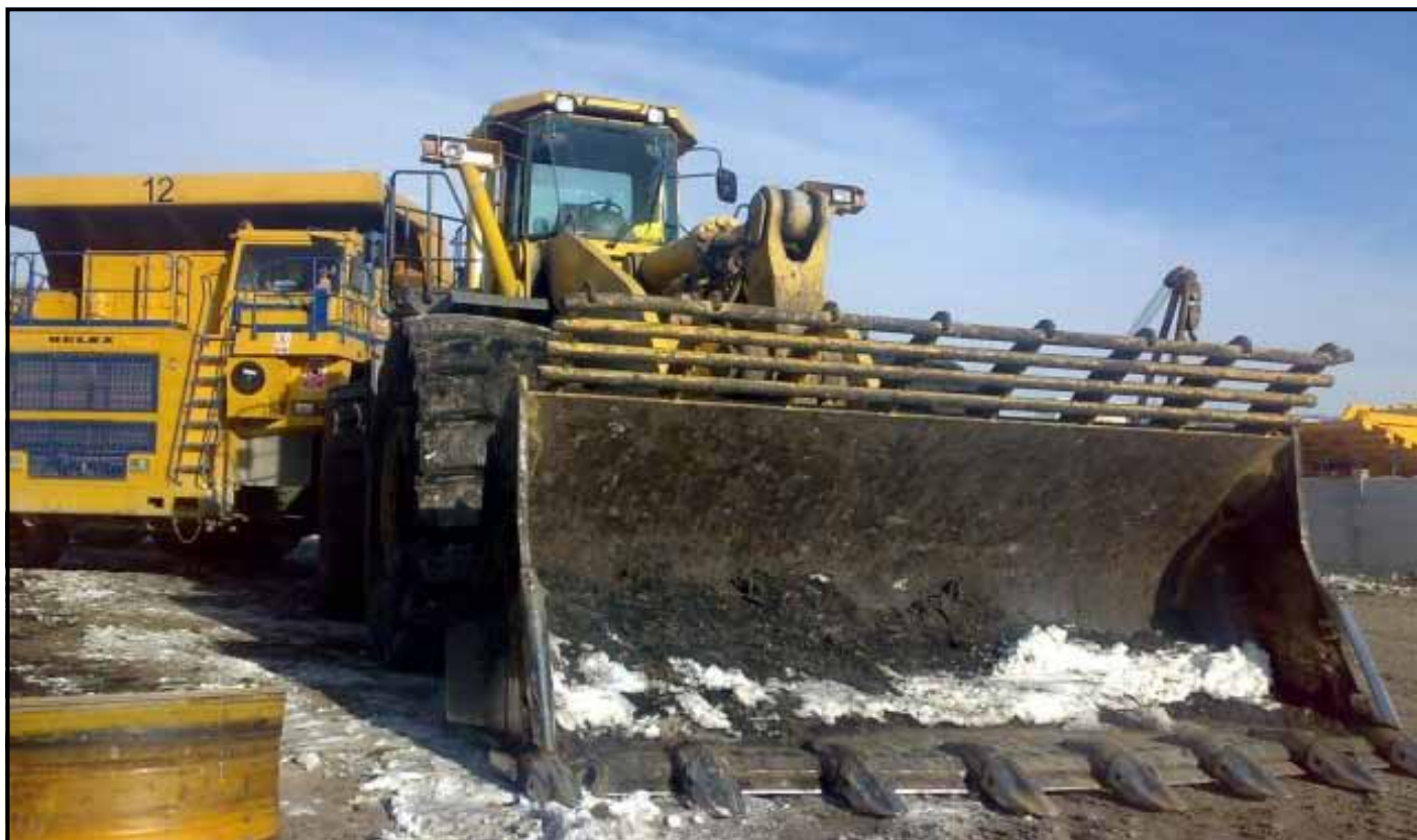
Механизација у руднику Гацко