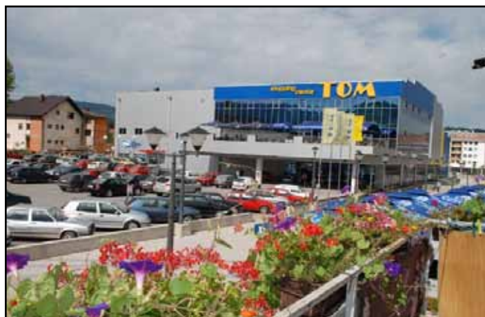
Тржни центар Конзум

Нови регулациони план и мастер план Јахорине дали су визију развоја најважнијег туристичког ресурса, који ће уз одговарајуће мјере зашти-