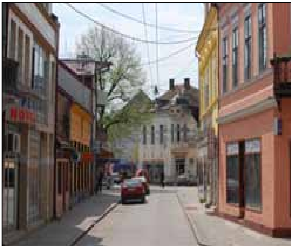
Центар Новог Града