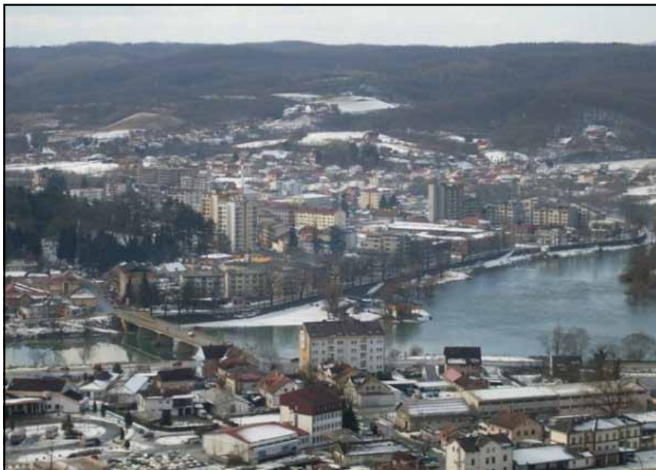
Панорама Новог Града