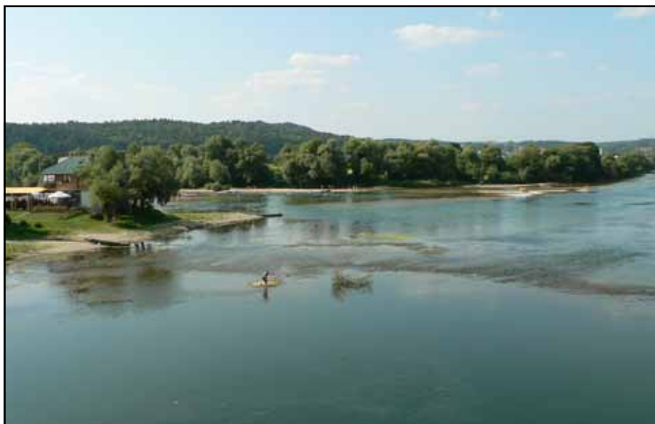
Ушће Сана у Уну налази се на самом улазу у Нови Град

Према подацима Одјељења за привреду производња у пластеницима је заснована на површини од око једног хектара, са тенденцијом раста. Највећи број пластеника се налази уз ријеку Уну, на подручју села Блатне, Рудица и Горњих и Доњих Ракана, па постоји могућност организованог откупа. У пластеницима се углавном узгаја паприка, парадајз и краставац али се због веће економичности у производњи уводе и друге културе краће вегетације – салата и шпинат. Производња у контролисаним условима има тенденцију повећања у циљу економичности производње. У порасту је и пластеничка производња расада, највише паприке и парадајза. Тренутно у општини Нови Град има пет регистрованих произвођача расада, који произведу око