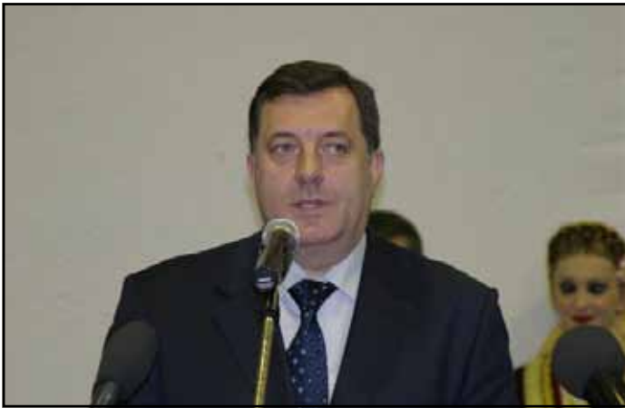
Предсједник РС свечано отворио требињску смојру вина

Посљедњих дана марта у Требињу је отворен већ традиционални, пети по реду, сајам вина у организацији Удружења виноградара и винара Источне Херцеговине - „Винос“. Иако је овај дио РС, по квалитету земљишта, сунца,