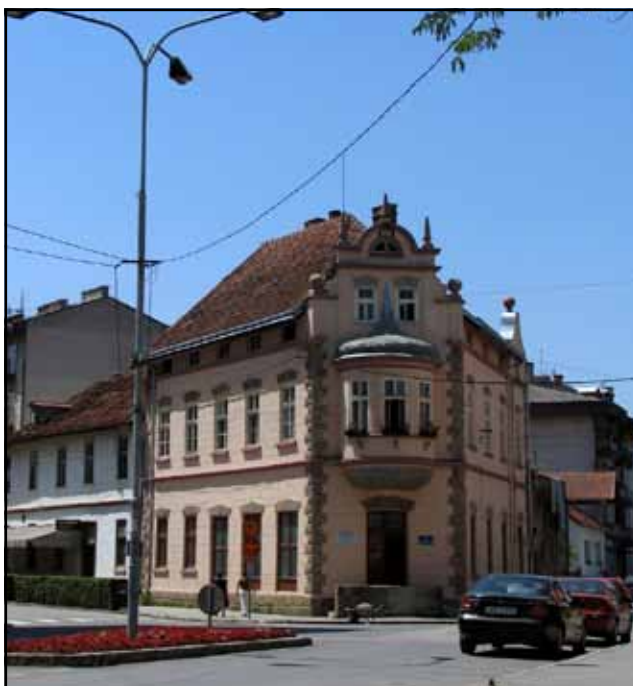
Народна библиотека Нови Град

Библиотека се финансира из средстава Министарства просвјете и културе за плате запослених, а из буџета општи-