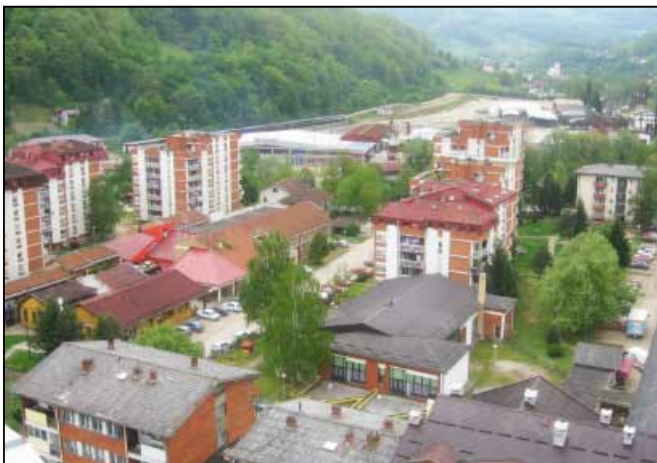
Пољед с њорња

Основно образовање у општини Милићи је организовано кроз рад матичне школе "Алекса Јакшић" и неколико подручних школа, у којима знања овог нивоа образо-