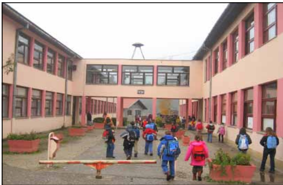
Основна школа "Алекса Јакшић"

стећака, чија старост датира из 12. вијека, а који свједоче о животу на овим просторима из тог времена.