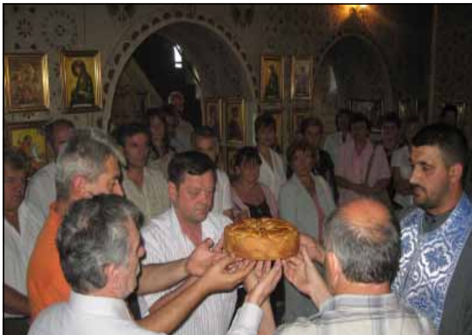
Свешћи пророк Илија, крсна слава ойшћине

сконцентрисане у урбаном дијелу Милића, али се предузимају кораци да се култура доведе и до руралног становништва. Ове активности се одржавају најчешће у објекту Дома рудара, љетној позорници, Омладинском центру, Народној библиотеци, те кроз секције у СЦ “Милутин Миланковић” и у ОШ “Алекса Јакшић”, а у посљедње вријеме и у објекту Спортске дворане. Домови културе у Дервенти и Новој Касаби се морају ускоро адаптирати и ставити у функцију како би се у овим срединама обезбиједили оптимални услови за културна дешавања.