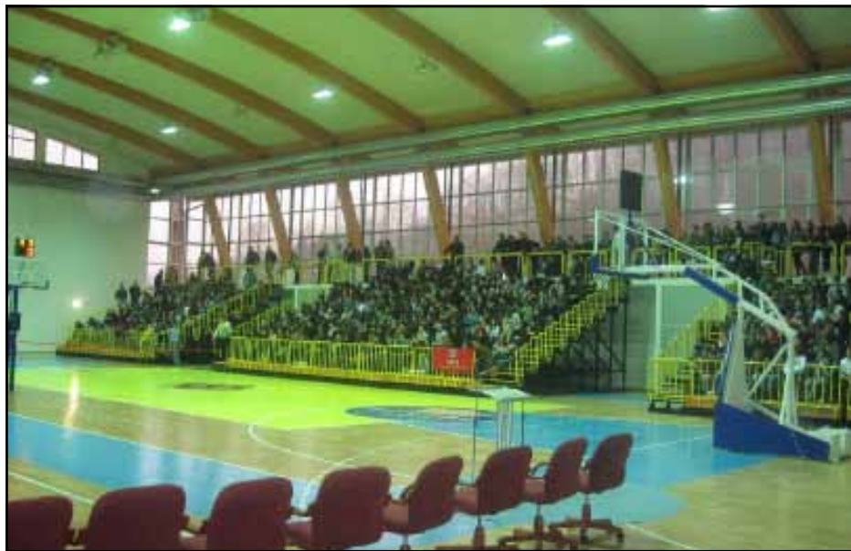
Хала I Спортског центра Милићи

Спортске активности на подручју општине Милићи су организоване преко Спортског друштва у чијем саставу функционишу ФК “Милићи”, ФК “Бирач” – Дервента, ФК “Јадар” – Нова Касаба, Карате клуб “Боксит” – Милићи, Удружења риболоваца – “Ми-