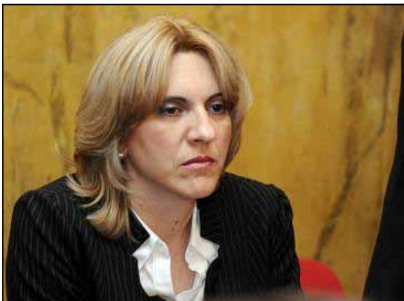
Министарка Жељка Цвијановић

ларне мреже БиХ, тако да се у том смислу разликује и њихов статус, као и статус запосленог особља у односу на функционере и особље дипломатских мисија. Путем својих