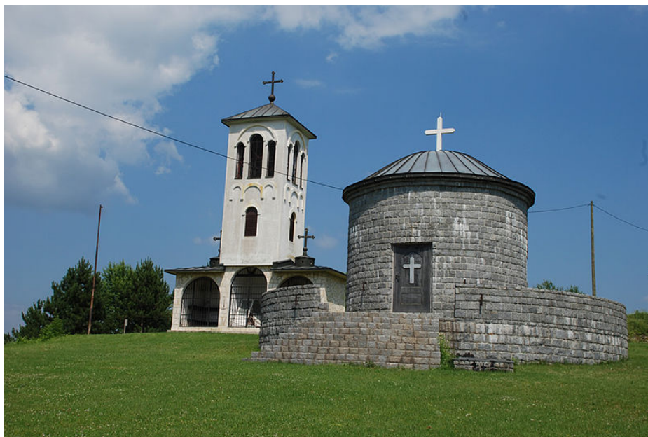
Црква св. Пејке Трнове

мјесну заједницу. Послије потписивања Дејтонског споразума највећи дио општине Зворник ушао је у састав Републике Српске. У састав Федерације БиХ ушла су насељена мјеста: Годуш, Краљевићи, Међећа, Растошница, Рожањ и Сапна, те дијелови насељених мјеста: Баљковица, Кисељак, Незук, Витиница и Засеок. Од овог подручја формирана је општина Сапна, а у саставу садашње општине Зворник формирана су три нова насеља - мјесне заједнице: Економија, Улице и Брањево чији житељи српске националности избјегли са територије данашње Федерације БиХ.