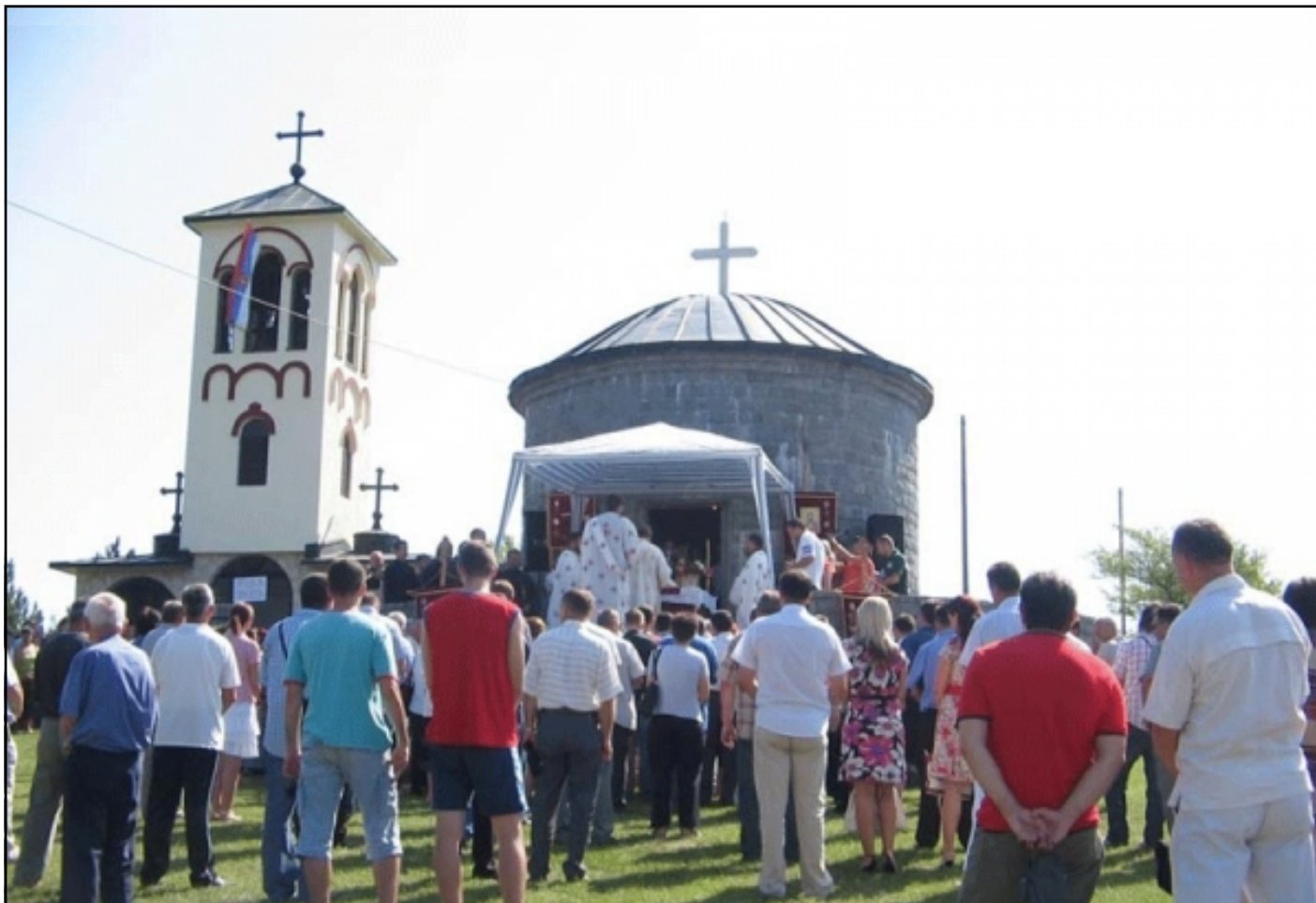
Обиљевање Свеште Пейке Трнове, крсне славе ойшћине Зворник

„Нови извор“ (грађевински и опекарски производи), „Житопромет“ (производња хљеба и пецива), „Јадар“ (прерада дрвета), „Дрина-обућа“ (производња обуће), „Фагум“ (производња гумених производа), „Инжењеринг“ (грађевинско предузеће), водопривредно предузеће „Дрина“, „Фамод“ (конфекцијска фабрика), „Хладњача“ (прерада и чување воћа и поврћа), као и „Мирјам“ (фабрика конфекције).