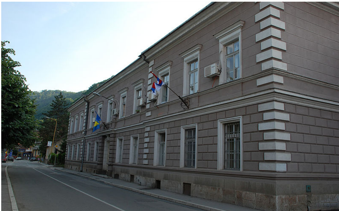
Зграда СО Зворник

имају уједно и највеће брзине. Максимална брзина ветра је забиљежена из јужног правца и износила је 100 км/х, и углавном причињавају штету на крововима и далеководним стубовима. Магле су карактеристичне уз долине, уз ријеку Дрину, Сапну и друге. Веома су честе и појављују се током цијеле године, а најозраженије су у прољеће и у јесен.