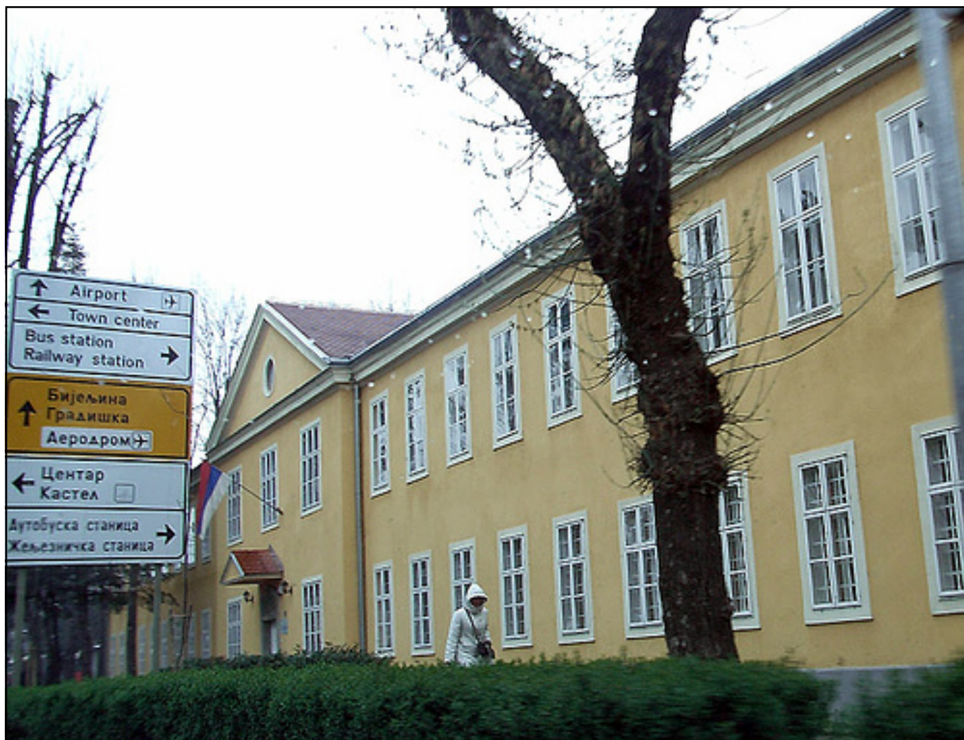
Царска кућа, главни објект Архива РС

ској окупацији Босне и Херцеговине. Током 2003–2006. објекат је темељно саниран и једини задовољава основне услове, како за рад запослених, тако и за смјештај архивске грађе у Републици Српској. Архивски депои у Бањалуци попуњени су архивским фондовима и збиркама и нису у стању да примају нову архивску грађу.