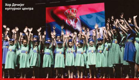
Хор Дечјег културног центра