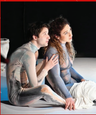
Представа „Седми дан“