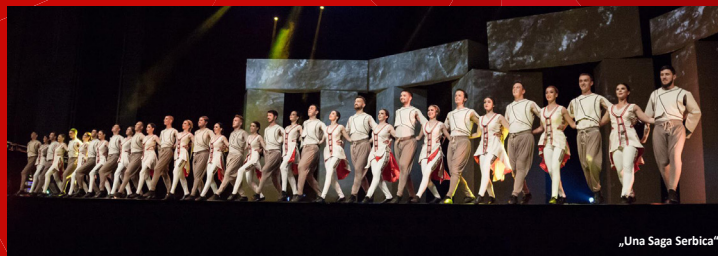
„Una Saga Serbica“