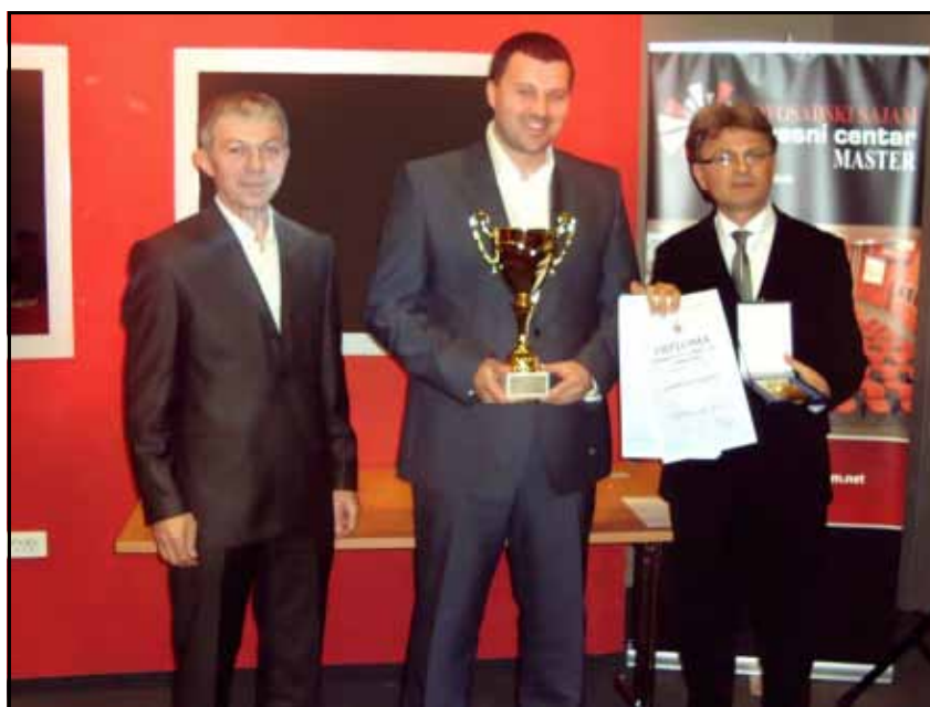
Dodjela pehara u Novom Sadu

nju inostranih tržišta, ili na razvoju komplementarnih djelatnosti, kao što su proizvodnja hercegovačkog sira i pšuta,