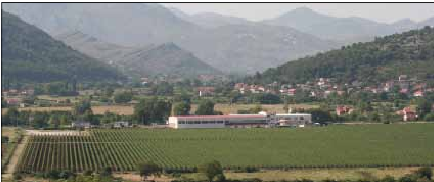
Vinogradi "Zasad Polje"

- Misija Vinosa je da se što bolje regulišu uslovi proizvodnje vina, da se uvede fiskalizacija, da se donese zakon o vinu kakav imaju sve najrazvijenije vinarske i vinogradarske zemlje u svijetu. Radimo i na tome da se spriječi prodaja vina i rakije na crno, da se ograniči uvoz grožđa sa drugih područja kako bi se zadržala lokalna specifičnost i autohtonost proizvoda i napokon, da zaštitimo brendove najboljih istočnohercegovačkih vina.