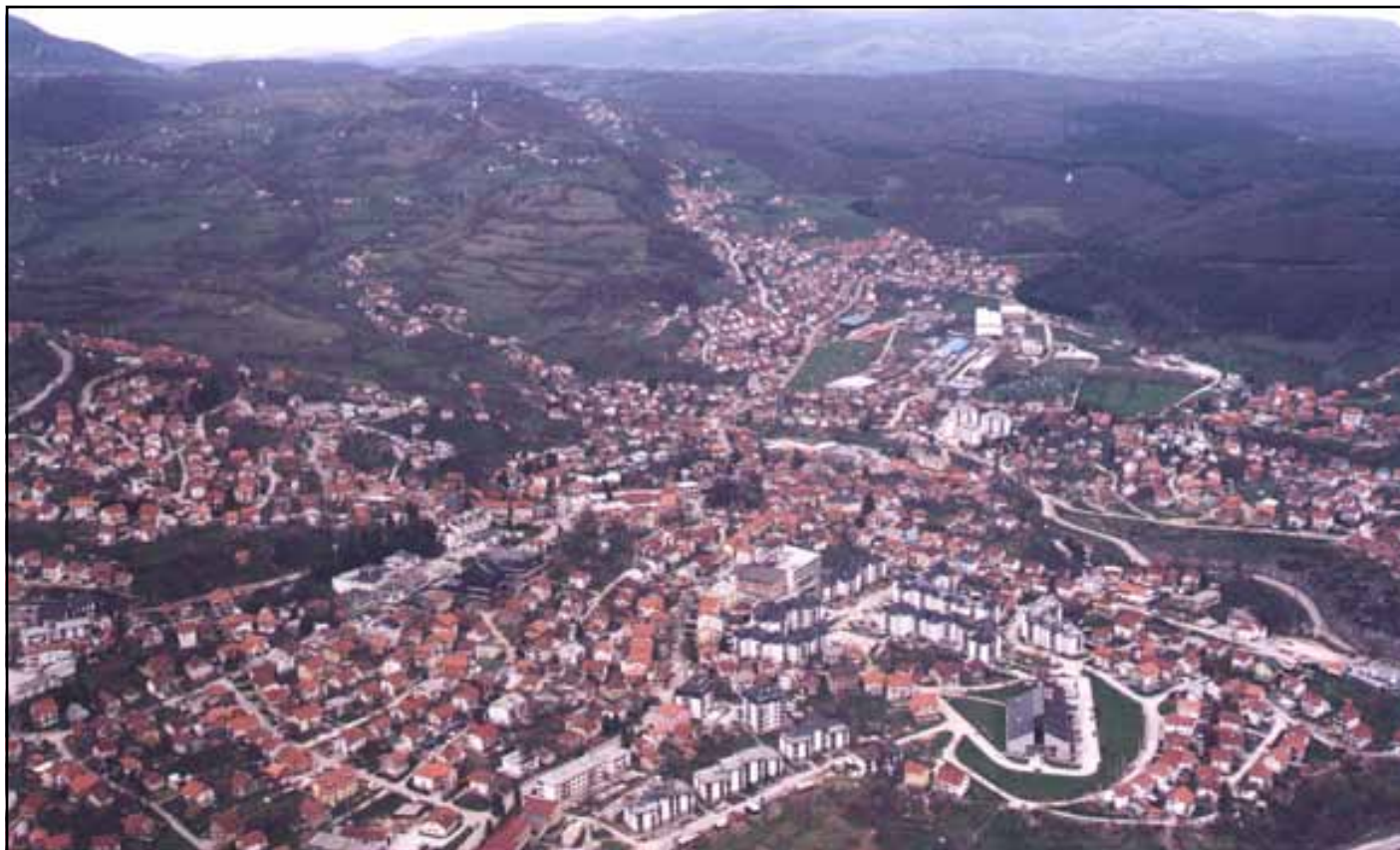
Panorama Mrkonjić Grada

52% spada u stanovništvo koje živi u ruralnim naseljima.