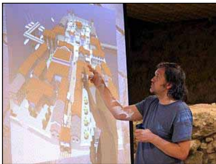
Emir Kusturica predstavlja plan Andrićgrada

privatno-javnom partnerstvu učestvovala će opština Višegrad, koja će obezbijediti lokaciju i infrastrukturu, te vlada RS sa