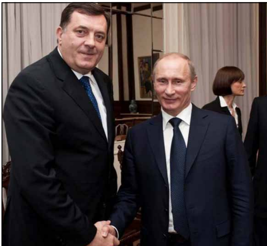
Dodik i Putin: Beograd, mart 2011. godine

Dodik se u Sankt Peterburgu najprije susreo sa ministrom inostranih poslova Rusije Sergejem Lavrovim i razgovarao o političkoj i ekonomskoj situaciji u RS, BiH i regionu. Zatim je na Međunarodnom ekonomskom forumu razgovarao sa ruskim ministrom energetike Sergejem Šmatkovim o dosadašnjim aktivnostima i rezultatima na planu ekonomske saradnje RS i Rusije, te o mogućnostima njihovog daljeg intenzivira-