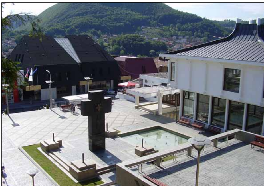
Trg vojske Srpske