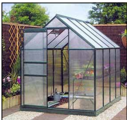
Nagrađeni projekat „Krov“

Bilježimo još jedan primjer naučno-tehnološke i priredne saradnje Srpske i Srbije u oblasti agrara. Radi se o kooperaciji inovatorskog tima „Krov“ iz Republike Srpske i poljoprivrednog preduzeća „Kooperativa“ iz Republi-