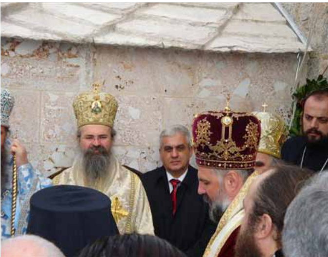
Liturgiju je predvodio episkop zahumsko-hercegovački Grigorije

U nedelju, 2. januara, svetom arhijerejskom liturgijom u Staroj crkvi, Mostar je nakon 18 godina ponovo postao sjedište Eparhije zahumsko-hercegovačke i primorske.