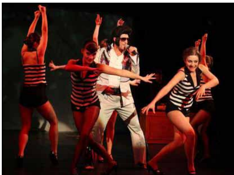
„Zvijezda je rođena“ u Ateljeu 212

Više sile zamijenila je mala manjina bogatstva i moći koja povlači sve konce nemarno zaklonjena iza scene. Služe se plitkim, providnim i neubjedljivim sredstvima, bez ikakvog