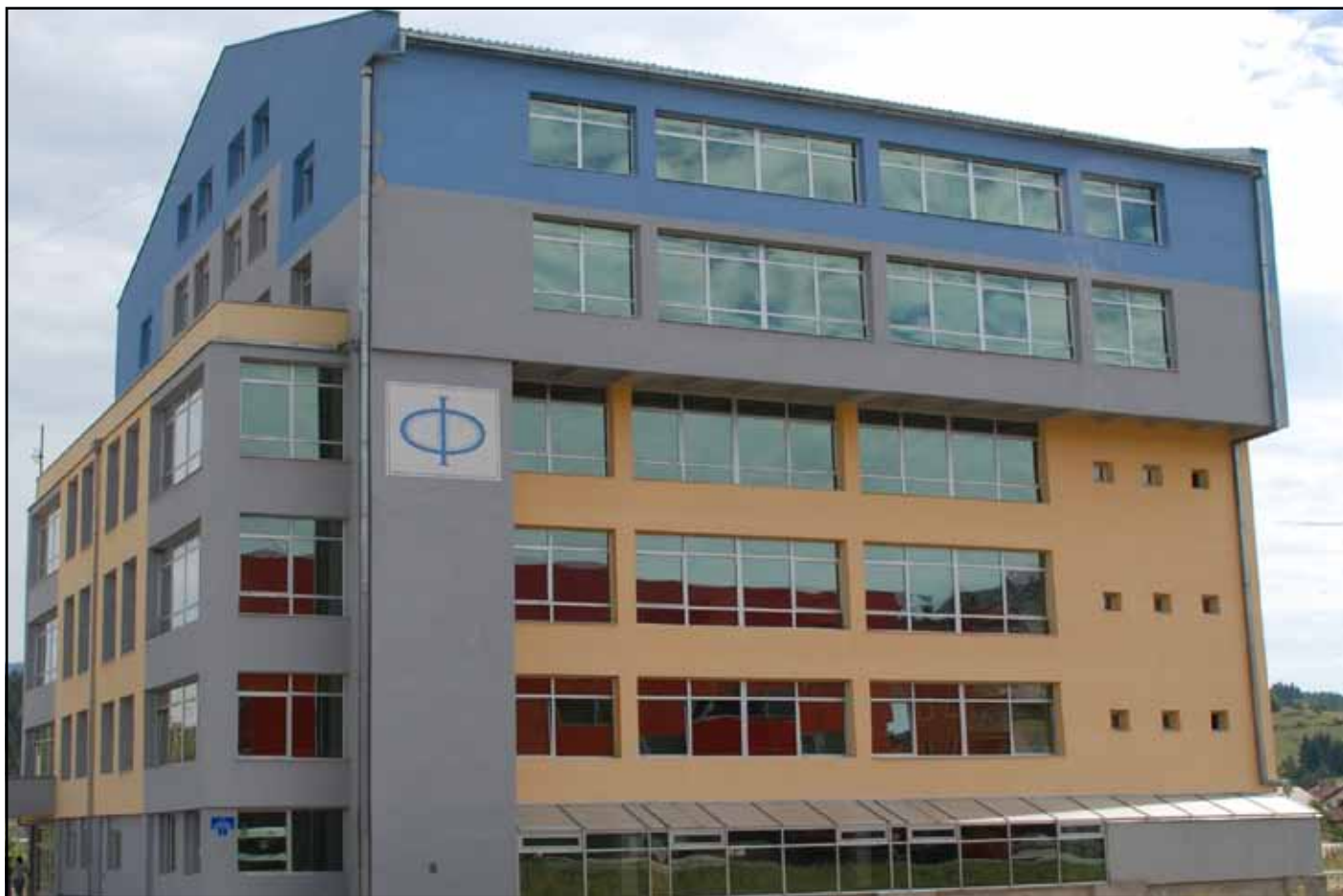
Zgrada Filozofskog fakulteta na Palama

Filozofski fakultet Univerziteta u Istočnom Sarajevu smješten je na Palama, univerzitetskom gradiću koji je 12 kilometara udaljen od olimpijske planine Jahorine. Spada u mlade fakultete sa vrlo dugom tradicijom, jer je njegov rad obnovljen (u tada Srpskom Sarajevu) ratne 1993. godine, a baštini naslijeđe Filozofskog fakulteta u Sarajevu, osnovanog 1950. godine. Zbog građanskog rata, više od 600