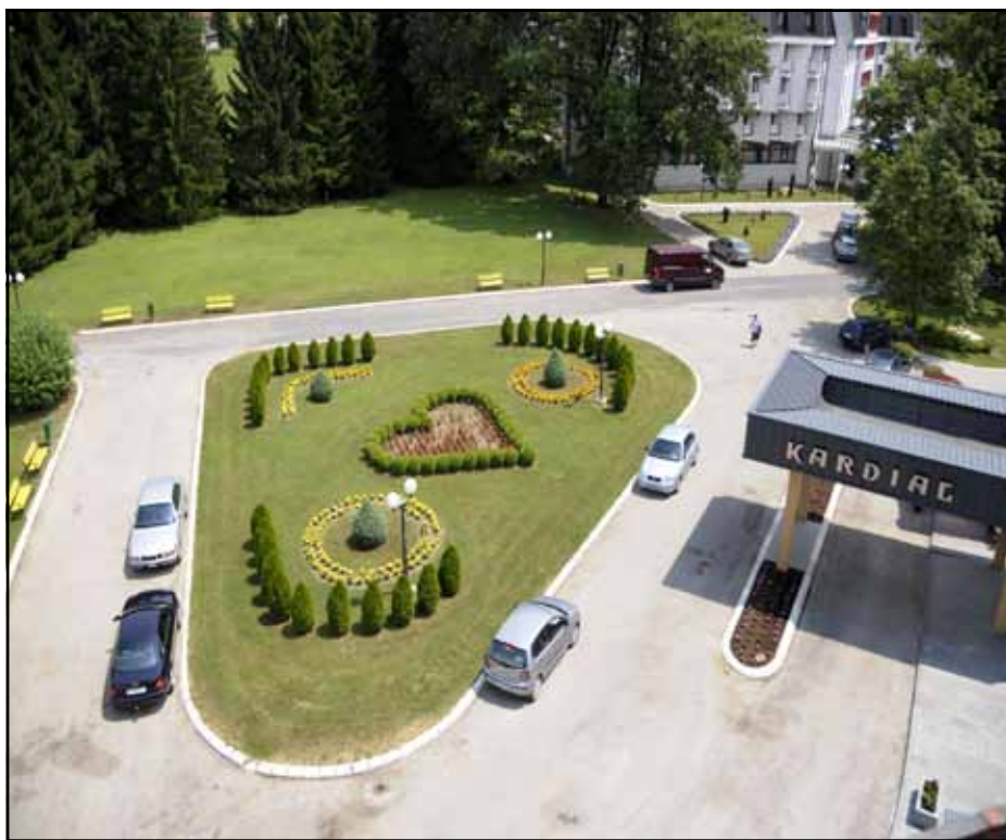
Parking ispred hotela „Kardial“

Osnovna djelatnost Zdravstveno-turističkog centra Banja Vrućica je medicinska rehabilitacija, koja se sprovodi u Specijalnoj bolnici za rehabilitaciju kardiovaskularnih oboljenja. Rehabilitacija i liječenje obuhvataju bolesnike nakon infarkta miokarda, kod kojih se obavljaju balon dilatacija i inplantacija stentova, bajpas operacije, operacije srčanih zalistaka, operacije na krvnim sudovima (a.karotis, aorta, krvni sudovi ekstremiteta). Pored toga, u Banji Vrućici sprovode se i rehabilitacija i liječenje reumatoloških, neuroloških