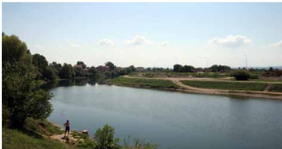
Podno Kozare, a pokraj Sane

i dr. Najveći izvoznici i uvoznici sa područja opštine Prijedor su: Arcelor MITTAL, Scontoprom d.o.o., Mira AD (Kraš grupacija), Lipa Drvo d.o.o, Saničani AD i MIP AD Prijedor.