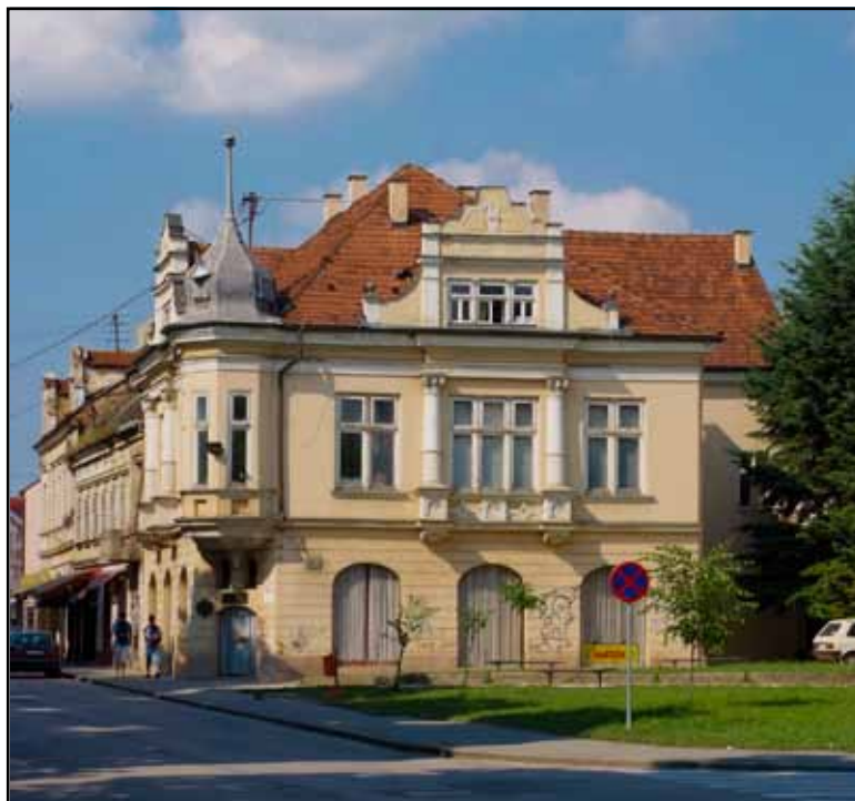
SKUD „Mladen Stojanović“

tada pa do današnjih dana slavu i ime Prijedora pronosili su širom bivše SR BiH i SFRJ fudbaleri, rukometaši, padobranici, karatisti, džudisti, ko-