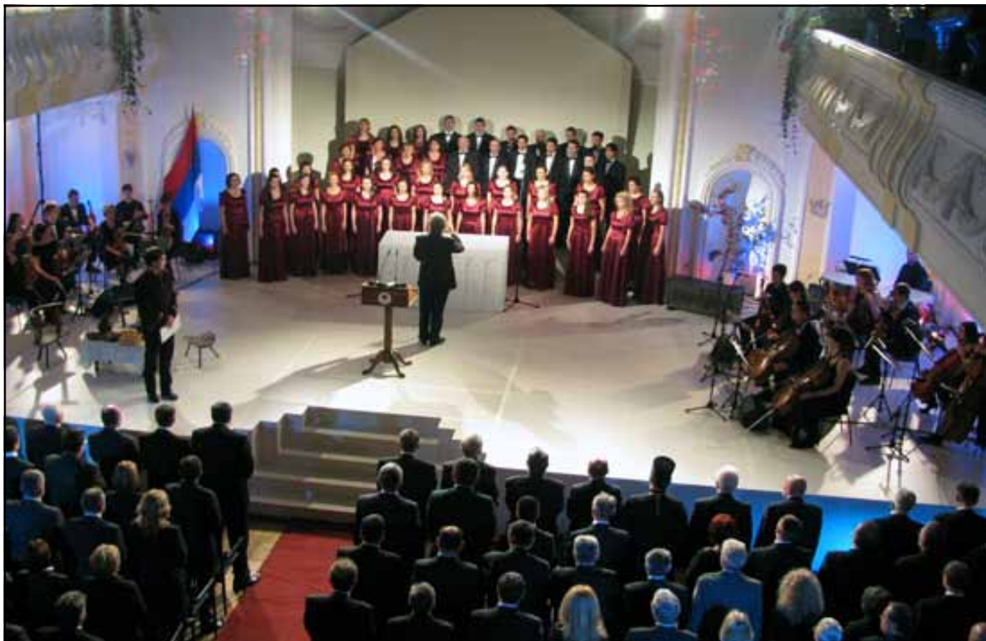
Svečana akademija povodom Dana i Krsne slave RS Svetog arhiđakona Stefana u Banskome dvoru

Na dan 9. januara Republika Srpska je proslavila svoj 19. rođendan. Na svečanoj akademiji održanoj u Banjaluci, kojoj je, pored najviših predstavnika političkog, vjerskog, privrednog i kulturnog života iz Srpske, BiH i regiona, u ime Republike Srbije prisustvovao premijer Mirko Cvetković, govorio je predsjednik RS Milorad Dodik.