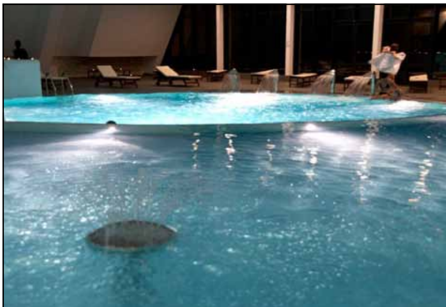
„Kardial“ - zatvoreni bazeni

Hotel „Srbija“ je lociran u podnožju Čubrinog gaja, kombinovane bjelogorične i crnogorične šume, i predstavlja pravu oazu mira. Raspolaže sa 76 soba, odnosno 167 ležaja u jednokrevetnim, dvokrevetnim, trokrevetnim i četverokrevetnim sobama i apartmanima. Sobe su opre-