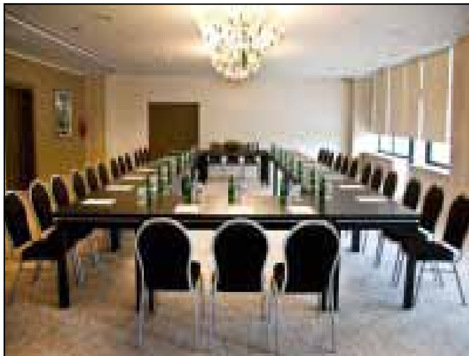
Kongresne sale su opremljene po svjetskim standardima

U visokom prizemlju hotela „Kardial“ nalazi se luksuzno opremljen restoran sa terasom kapaciteta 346 mjesta sa širokim asortimanom jela i pića, kao i ekskluzivan restoran namijenjen gostima koji