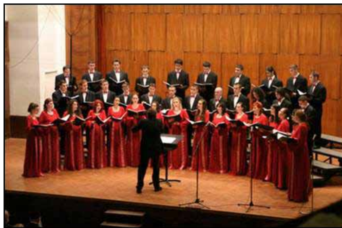
Kamerni hor Muzičke akademije

Trenutno se na Muzičkoj akademiji školuju 292 studenta, iz Republike Srpske, Bosne i Hercegovine, Srbije, Crne