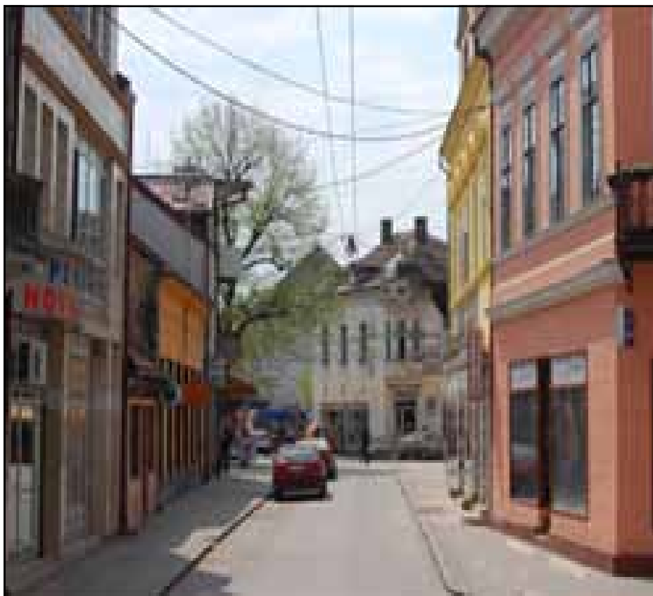
Centar Novog Grada

Magistralni putevi: 50 km (Novi Grad – Bihać, Novi Grad – Banjaluka, Novi Grad – Kostajnica).