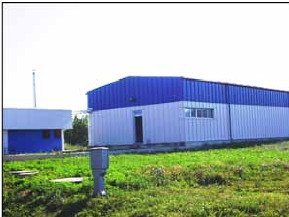
Industrijska zona „Poljavnice“

utiče na razvoj poljoprivredne proizvodnje.