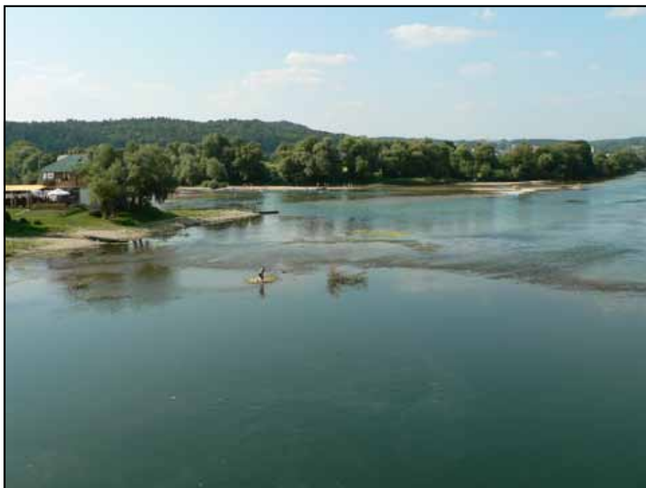
Ušće Sane u Unu nalazi sa na samom ulazu u Novi Grad

Prema podacima Odjeljenja za privredu, proizvodnja u plastenicima je zasnovana na površini od oko jednog hektara, sa tendencijom rasta. Najveći broj plastenika se nalazi uz rijeku Unu, na području sela Blatne, Rudica i Gornjih i Donjih Rakana, pa postoji mogućnost organizovanog otkupa. U plastenicima se uglavnom uzgaja paprika, paradajz i krastavac ali se zbog veće ekonomičnosti u proizvodnji uvode i druge kulture kraće vegetacije – salata i špinat. Proizvodnja u kontrolisanim uslovima ima tendenciju povećanja u cilju ekonomičnosti proizvodnje. U porastu je i plastenička proizvodnja rasada, najviše paprike i paradajza. Trenutno u opštini Novi Grad ima pet registro-