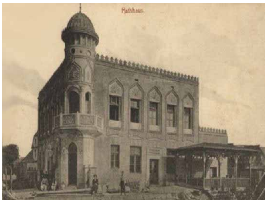
Zgrada Vijećnice izgrađena je 1888. godine

Broj kontejnera za selektivno prikupljanje otpada: 87.