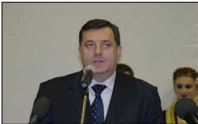
Predsjednik RS svečano otvorio trebinjsku smotru vina

Posljednjih dana marta u Trebinju je otvoren već tradicionalni, peti po redu, sajam vina u organizaciji Udruženja vinogradara i vinara Istočne Hercegovine - „Vinos“. Iako je ovaj dio RS, po kvalitetu zemljišta, sunca, kli-