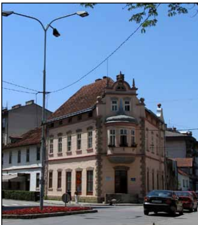
Narodna biblioteka Novi Grad

Unutrašnjost Biblioteke sastoji se od 140m 2 neuslovnog prostora, u kojem je smješteno oko 25.000 knjiga, zajednička čitaonica za djecu