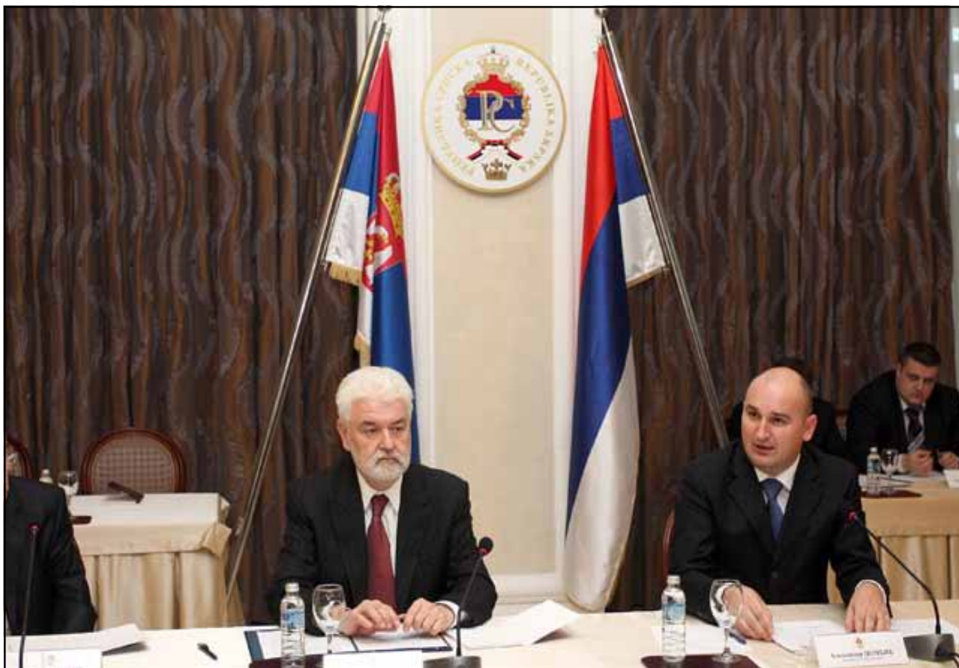
Premijeri Cvetković i Đombić predsjedavali su zajedničkoj sjednici

Polovinom prošlog mjeseca (18. mart) u Banjaluci je održana prva zajednička sjednica vlada Republike Srbije i Republike Srpske koju su mnogi učesnici ocijenili kao istorijsku. Sjednici su zajednički predsjedavali premijeri Srbije i Srpske Mirko Cvetković i Aleksandar Đombić. Uz konstataciju da odnosi između Beograda i Banjaluke nikada nisu bili na višem nivou, potpisano je više memoranduma