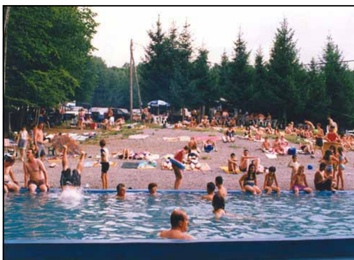
Banja Lješljani - bazen

Biogeografske vrijednosti opštine se odnose na bogatstvo biljnim i životinjskim svijetom, od kojih je posebno značajno bogatstvo ribljim vrstama u vodama Une i Sane, te fond divljači u šumama opštine. Biogeografski potencijali