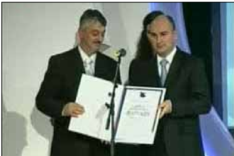
Premijer Džombić dodijelio je priznanje direktoru prvonagrađenog preduzeća

Predsjednik Privredne komore RS Borko Đurić naglasio je da i u najtežim situacijama i okolnostima postoje firme koje dobro rade. On je podsjetio da je 2010. godinu obilježila ekonomska kriza koja se, između ostalog, ogledala u smanjenju investicija. Đurić je napomenuo da su mjere Vlade RS o ublažavanju efekata ekonomske krize bile veoma značajne.