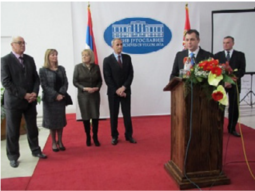
Предсједник Народне скупштине Игор Радојичић је оворио изложбу

грубо је игнорисана воља српског народа да остане у Југославији, која је јединствено потврђена на плебисциту одржаном 9. и 10. новембра 1991. године. Седамдесет и два посланика СДС-а и једанаест из осталих странака формирали су јединствен национални блок, легитиман да представља српски народ у БиХ.