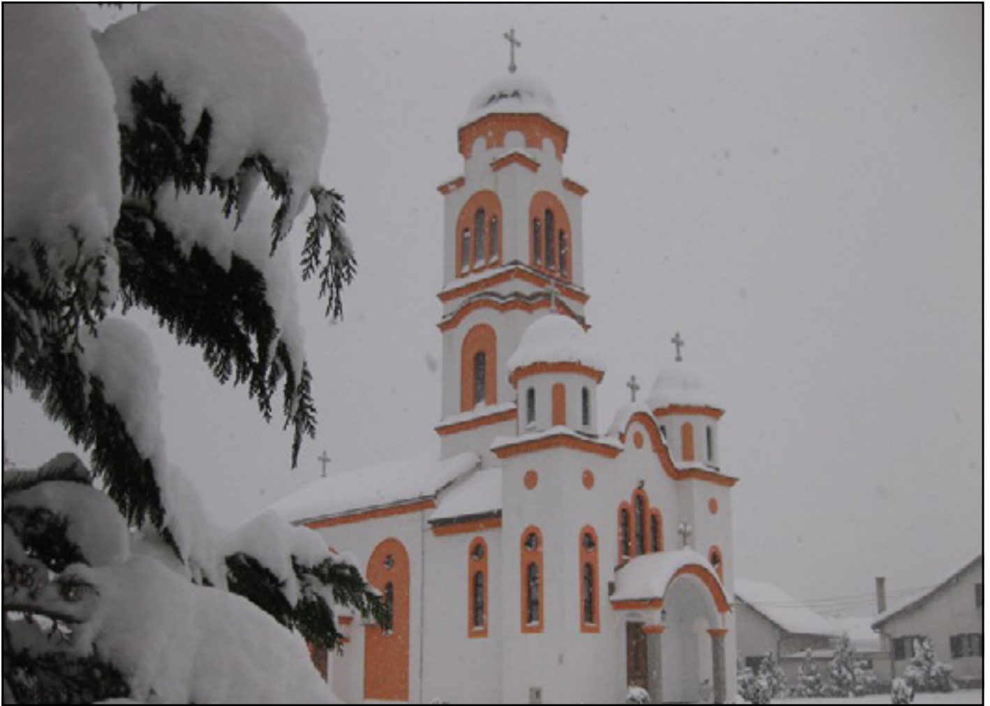
Храм свеште Тројице

земљиште, кестен, минерале) и чисту незагађену околину, можемо рећи да општина Костајница није у потуности искористила ове предности.