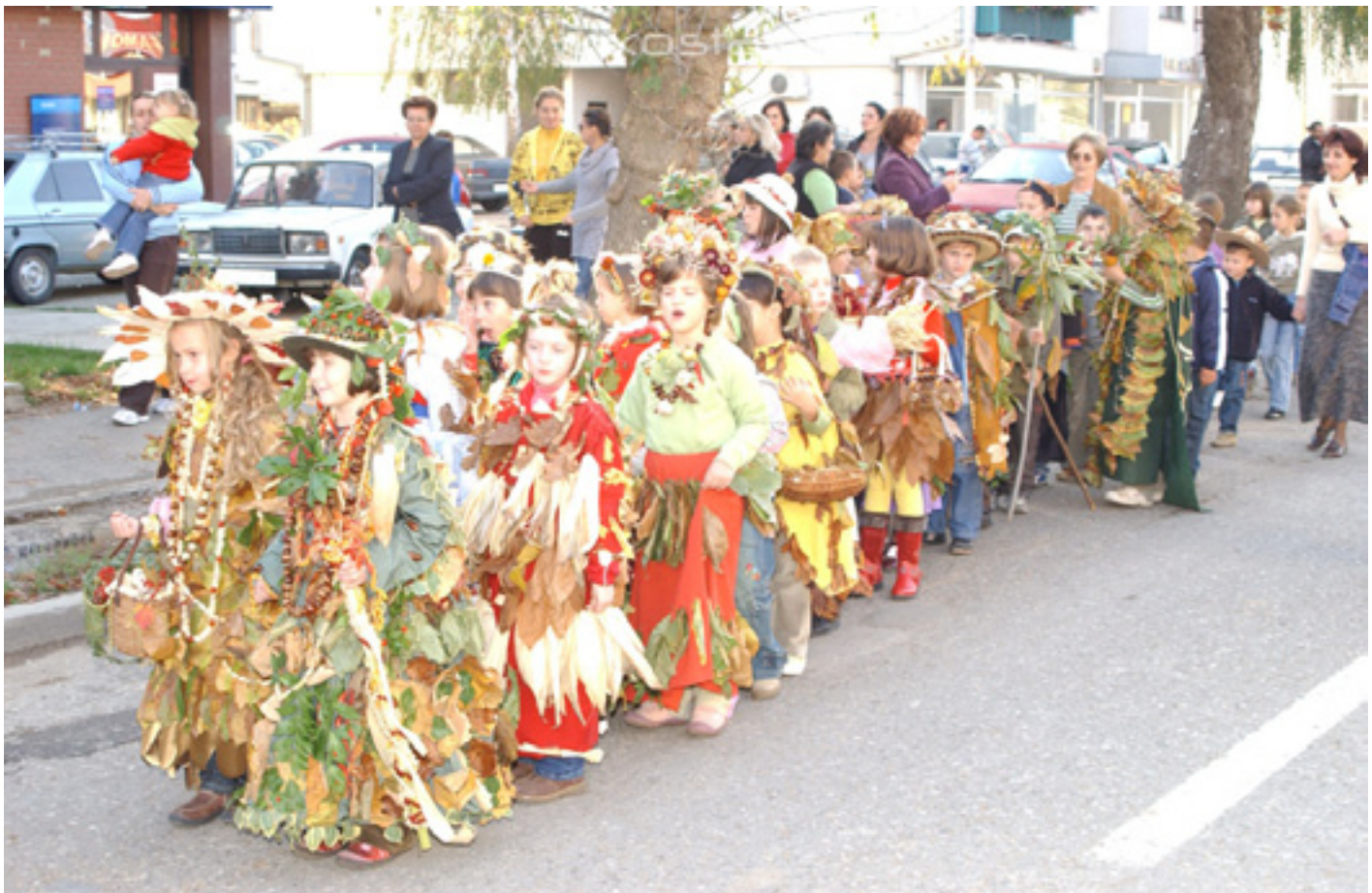
Кесћенијада у Косћајници

Градско зеленило на подручју општине Костајница чине: парк површине 1.224,00 м 2 , који се налази у центру града и травнате површине уз тротоаре. Заступљеност уличних дрвореда је ниска.