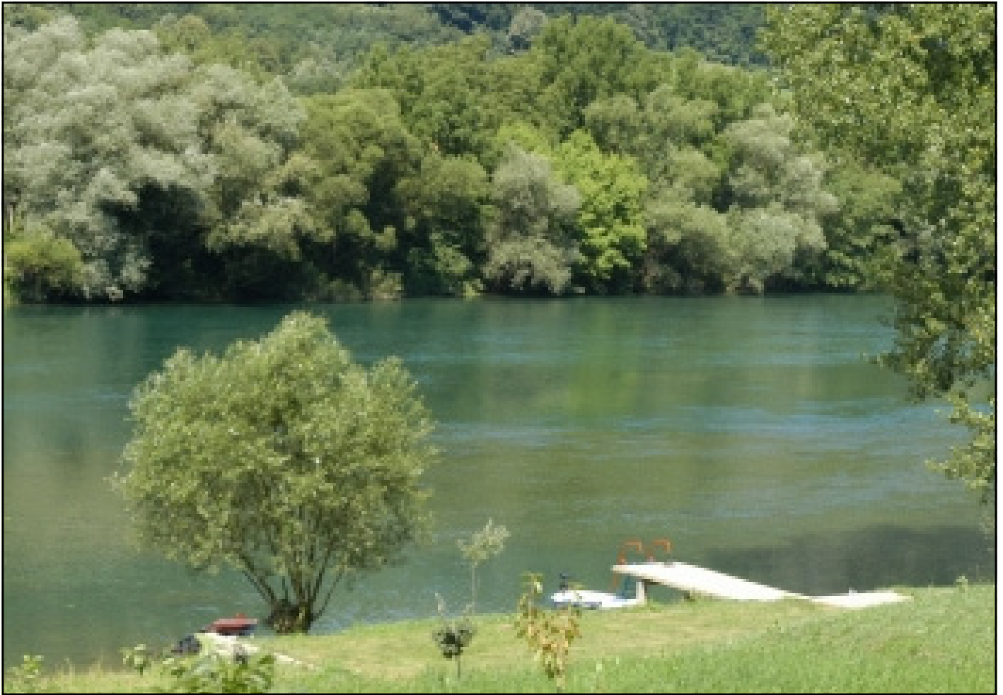
Купалиште на Уни

и не постоји довољно капацитета за прераду пољопривредних производа. У том смислу је стратешка одређеност општине на унапређење стања у пољопривреди, превазилажењем свих наведених слабости у циљу коначног ефектирања пољопривредне производње, а то је производња здраве хране у еколошки чистој и здравој средини.