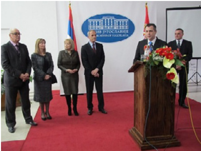
Predsjednik Narodne skupštine RS Igor Radojičić je otvorio izložbu

jedinstveno potvrđena na plebiscitu održanom 9. i 10. novembra 1991. godine. Sedamdeset i dva poslanika SDS-a i jedanaest iz ostalih stranaka formirali su jedinstven nacionalni blok, legitiman da predstavlja srpski narod u BiH. Na osnovu ustavno zagaranovanog prava na samoopredjeljenje do otcjepljenjla, donijeli