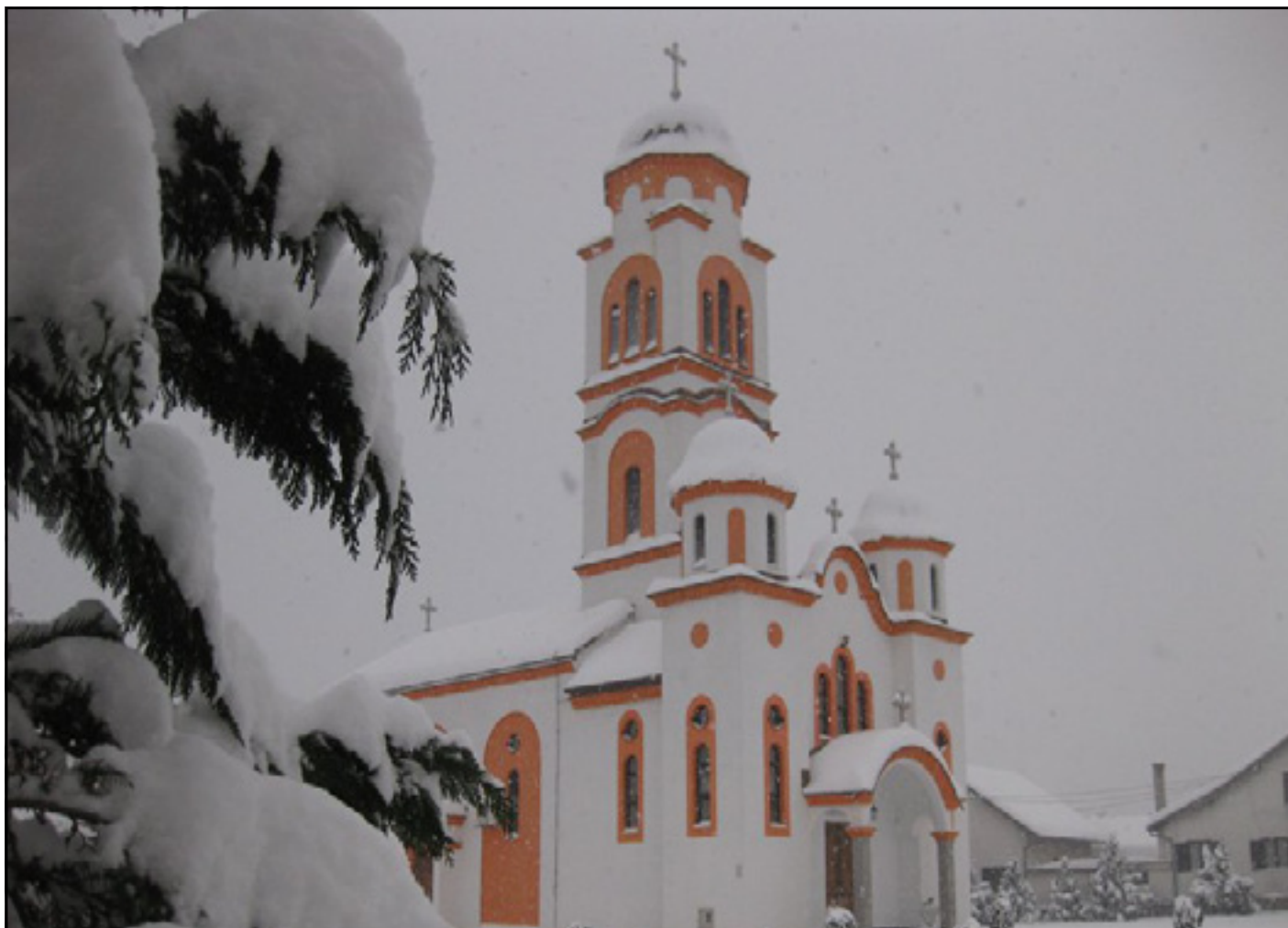
Hram Svete Trojice

reći da opština Kostajnica nije u potpunosti iskoristila ove prednosti.