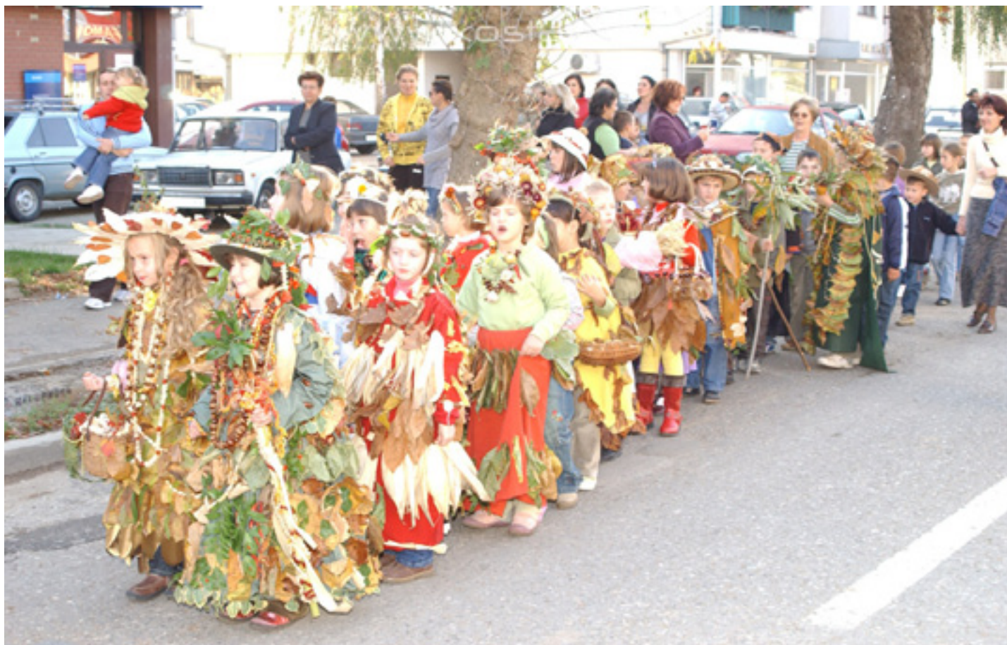
Kestenijada u Kostajnici

grada i travnate površine uz trotoare. Zastupljenost uličnih drvoreda je niska.