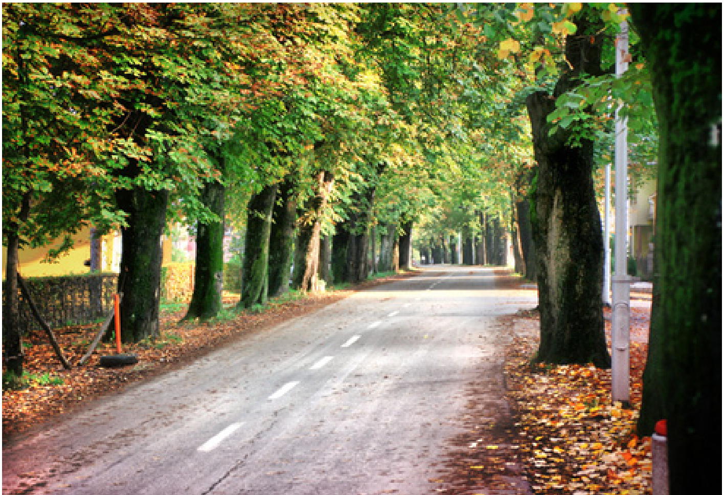
Прњавор - дрворед

да са карактеристичним брежуљкасто-терцијарним земљиштем које пружа веома повољне услове за развој пољопривреде. Од укупне површине општине, на обрадиво земљиште отпада око 68 %, на шумско богатство отпада око 28% а остатак је изграђено земљиште и воде. Обрадиво пољопривредно земљиште је површине 38264,60 ха од чега је 35803,80 ха у власништву физичких лица а 2460,80 ха у државном власништву.