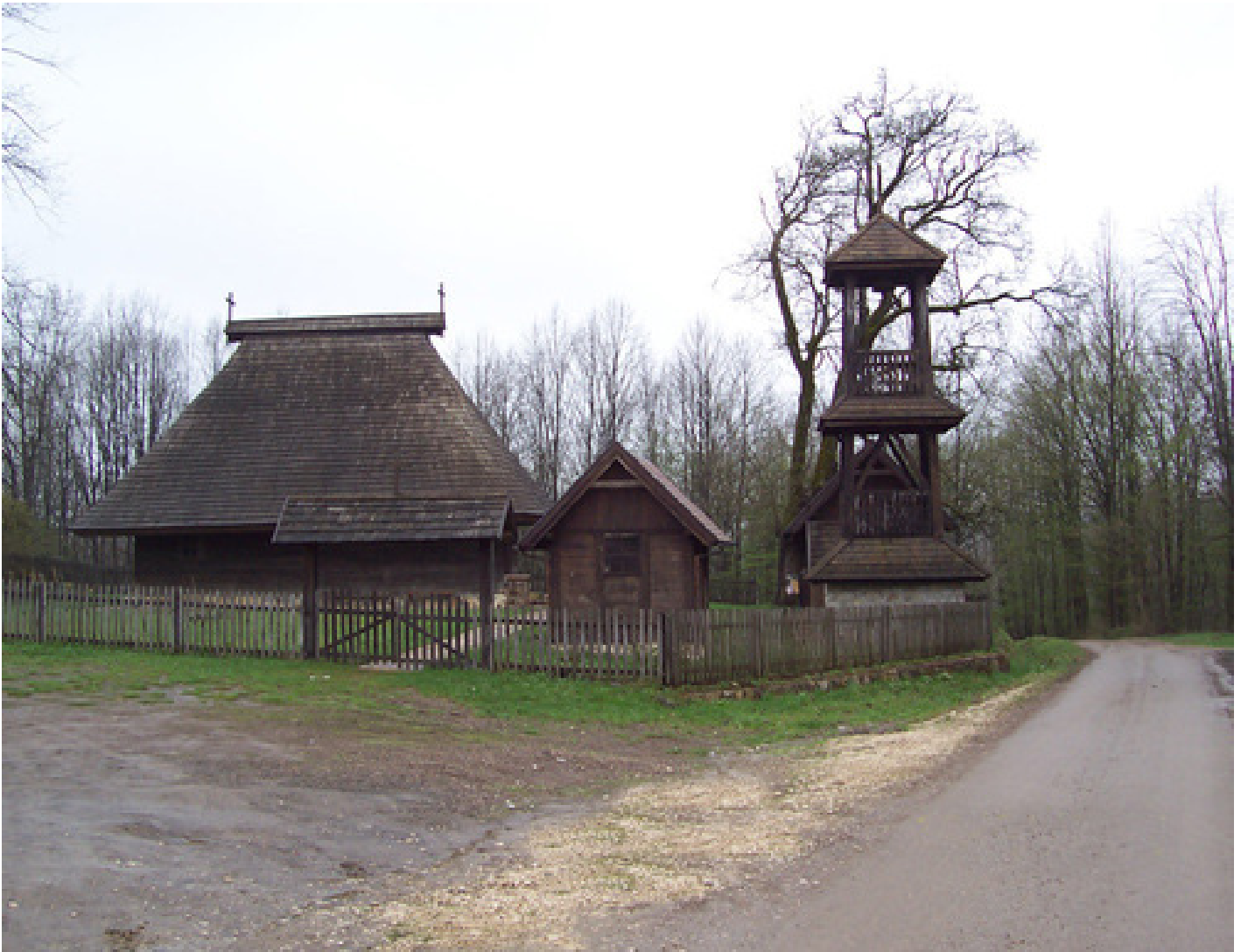
Црква "Брвнара" у Палачковицама

уз ријеку Манастирку. По предањима на мјесту данашњег манастира било је много ступа за набијање конопље, па је ту преко ноћи осванио манастир. Манастир је био посвећен Светом Архангелу Михаилу, па се предом изнад њега звао и данас зове Михаиловац. Претпоставља се да је Манастир Ступље изграђен у XIII вијеку када и Манастир Липље (1249. године), због тога су у књигама увијек заједно помињани као два близанца и страдалници од паљевина за вријеме турске