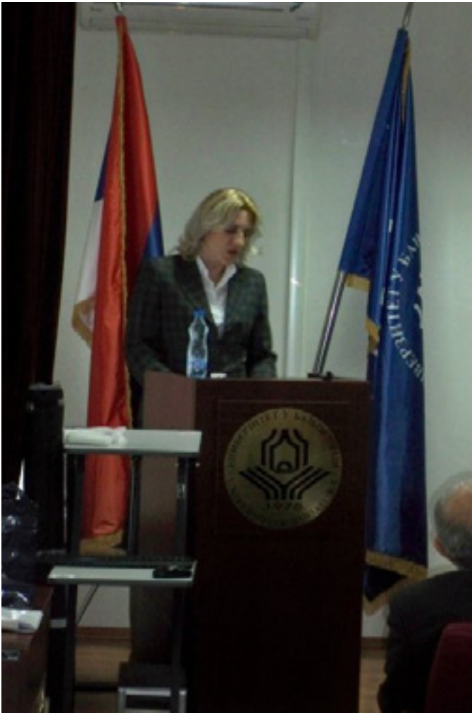
Министар Жељка Цвијановић у обраћању ђолазницима

уз присутних. “Ја сам у почетку своје политичке каријере у сусретима са странцима, овдје и у иностранству, морао да се