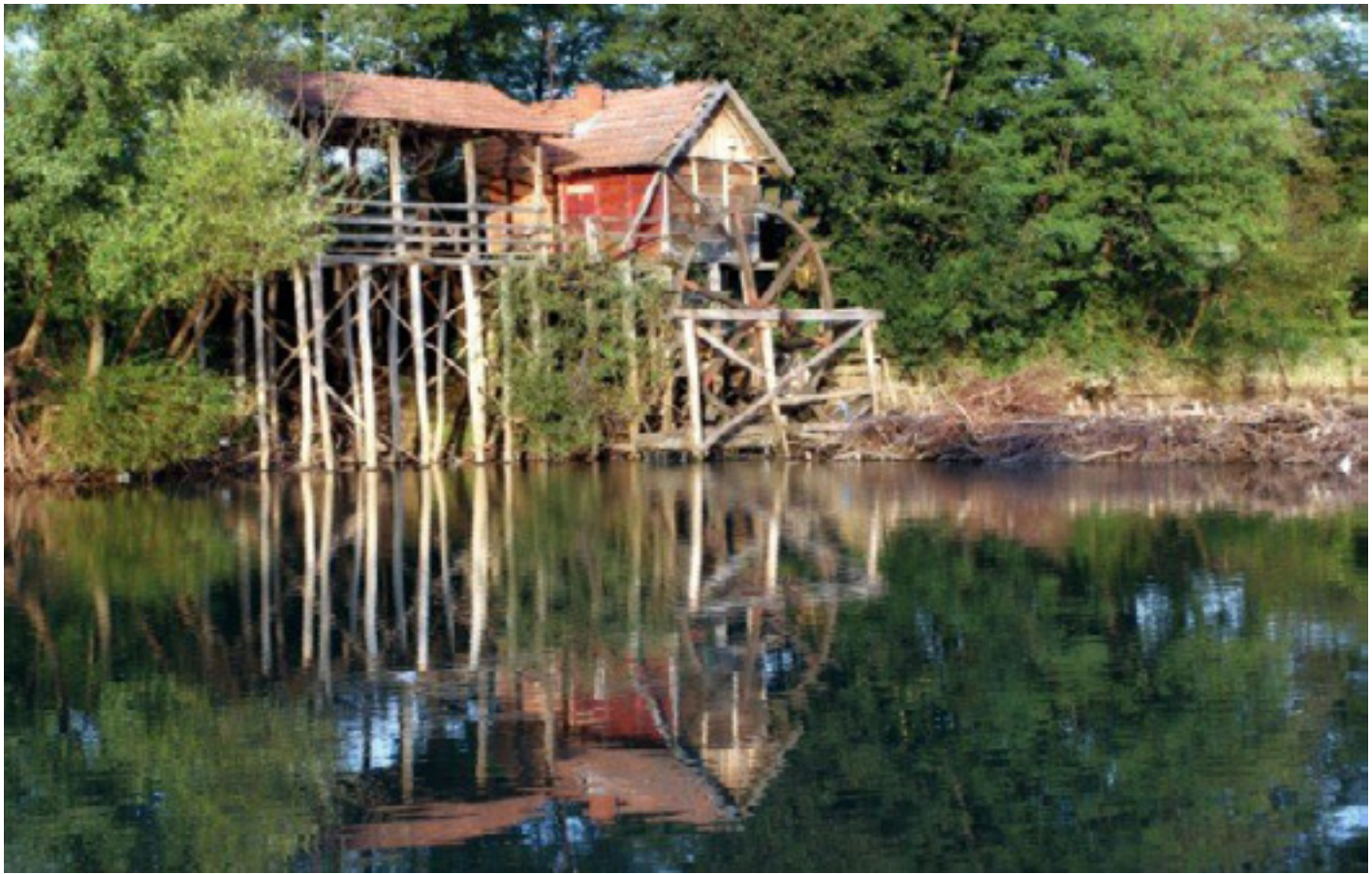
Стевића млин на Укрини

велики генетски потенцијал ове престижне расе коња. Велики рибањаци на Укринском лугу. Језеро „Дренова“, удаљено свега 6 км од града, пружа разне могућности рекреације као што су купање, риболов, камповање и друге спортско-рекреативне могућности.