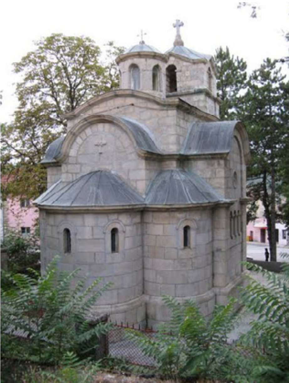
Mala crkva u Bileći

poljima i otvaranja novih proizvodnih i drugih kapaciteta.