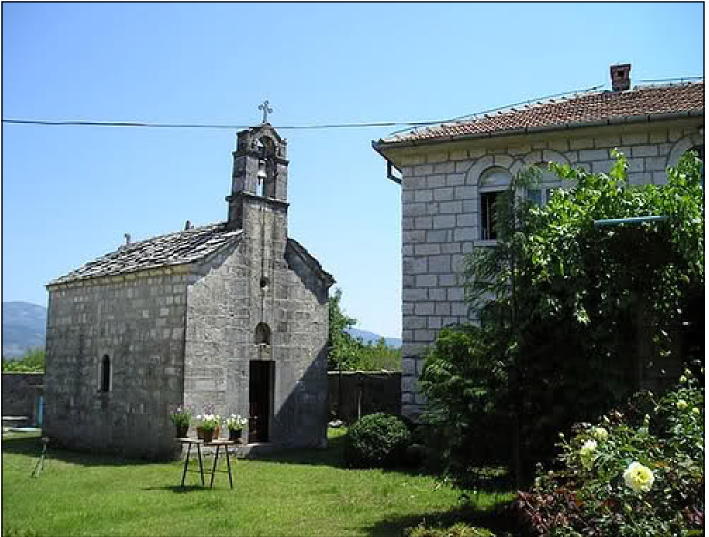
Manastir Dobričevo iz 13. vijeka

no 20,9 st/km 2 . U poslijeratnom periodu Bileća je imala pozitivna prirodna kretanja stanovništva, uz naglašenu tendenciju smanjivanja nataliteta i smanjivanja i uravnoteživanja mortaliteta.