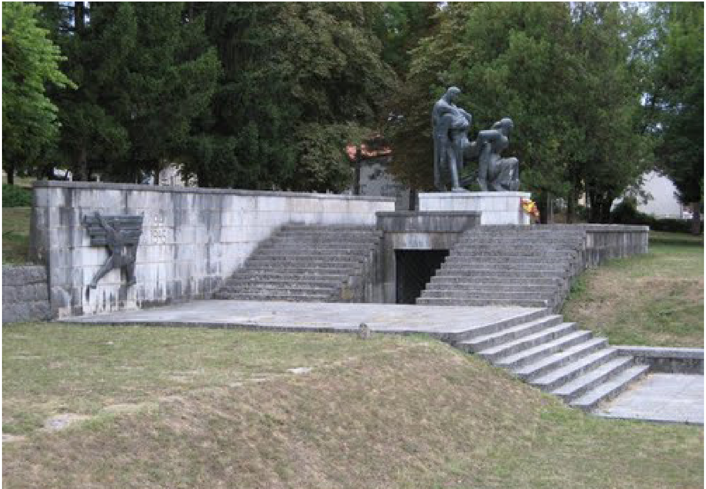
Spomenik narodnih heroja