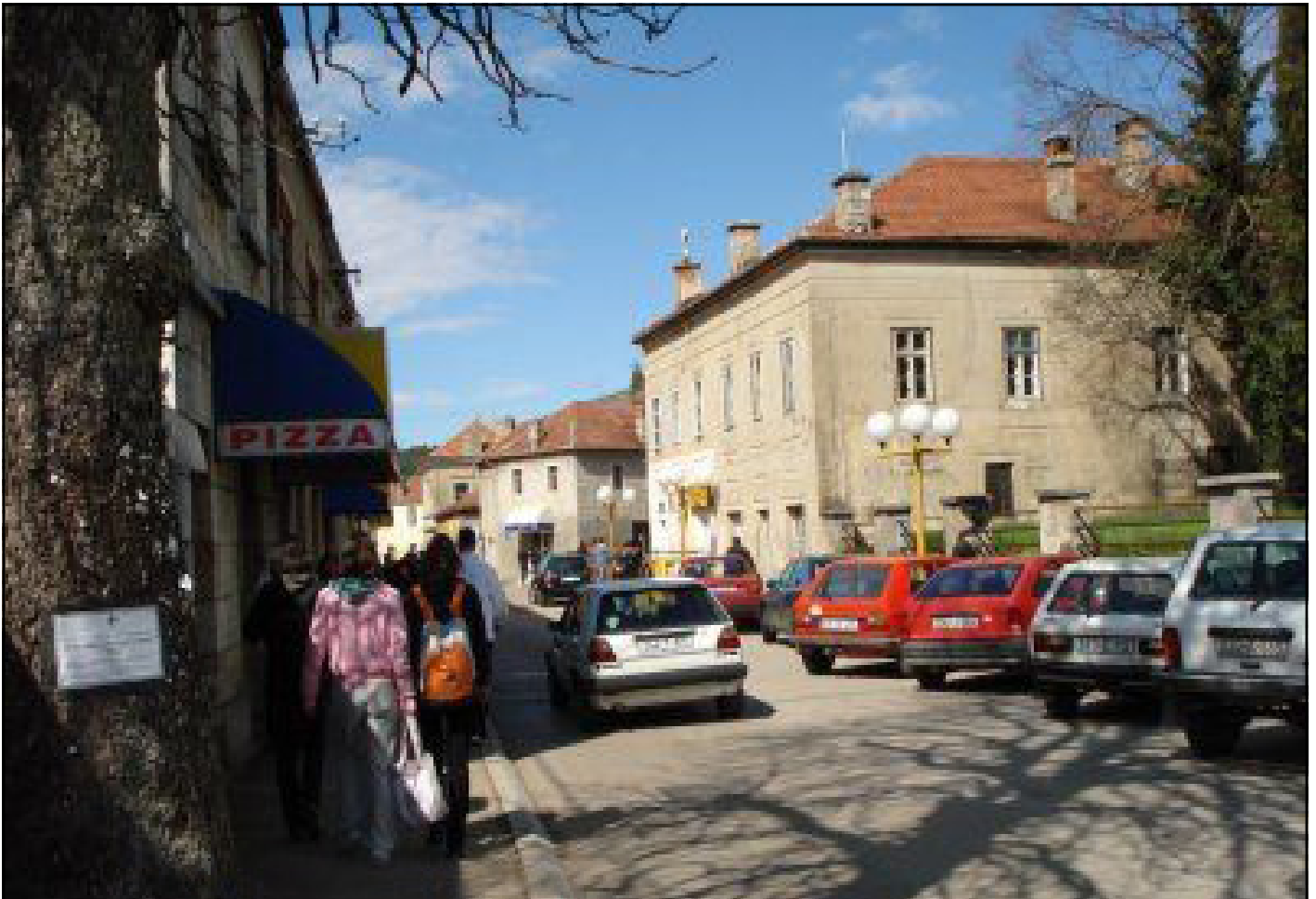
Ulica u Bileći

i Vojvodinu, a krajem XIX i početkom XX vijeka u Americu. Prema popisu stanovništva 1910. godine u inostranstvu je radilo 1.416 Bilećana, od čega 1.131 u Americi.