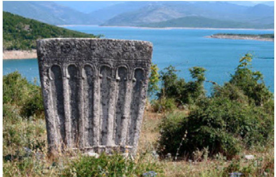
Nekropola stećaka iz srednjeg vijeka na obali Bilećkog jezera

10 km južno od Bileće. Posebnom ljepotom ističe se crkva Sv. proroka Ilije na malom ostrvu u srcu Bilećkog jezera