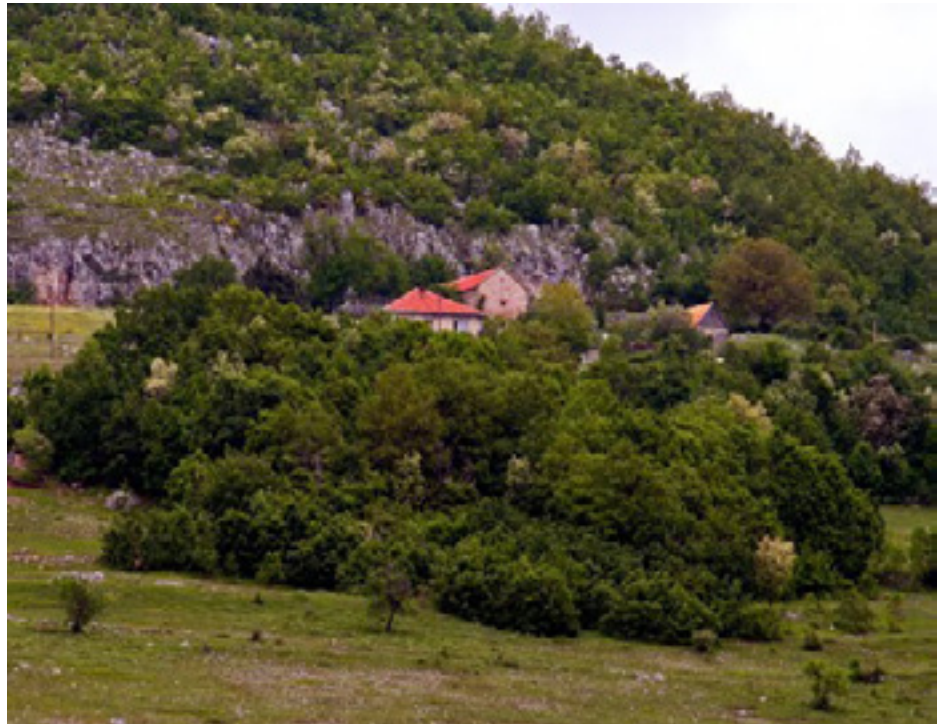
Pogled na selo Kačanj

Med sa ovog područja je izuzetne biološke i energetske vrijednosti jer ovaj kraj obiluje medonosnim biljkama i ekološki čistom sredinom.