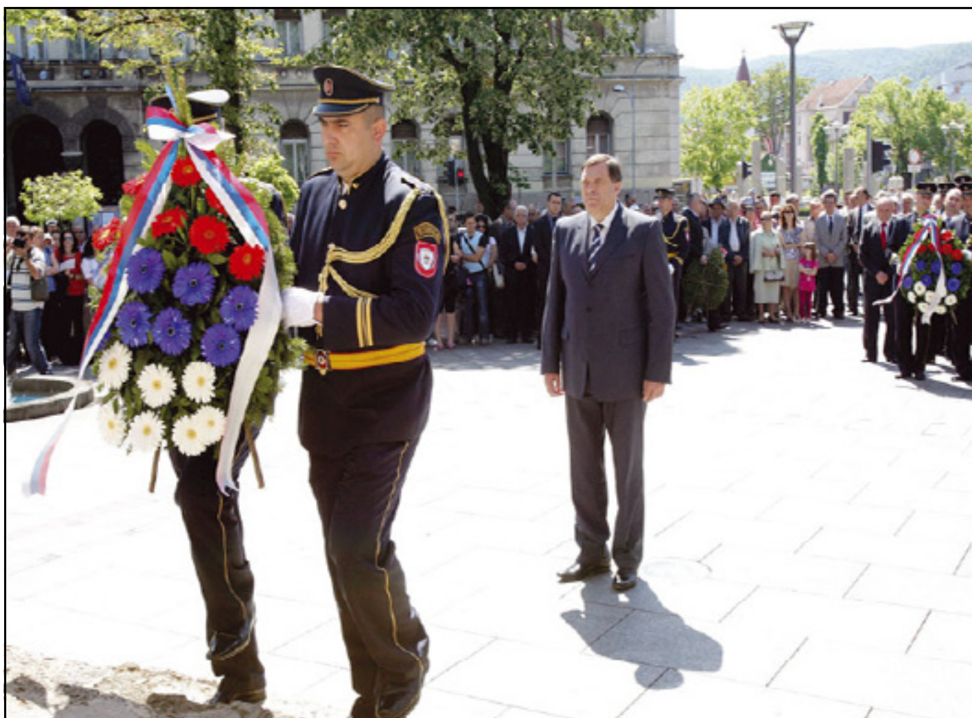
Predsjednik Dodik položio je vijence na spomenik poginulim borcima Narodnooslobodilačkog rata u Banjaluci

Republika Srpska je 9. maja obilježila Dan pobjede nad fašizmom polaganjem cvijeća na spomen-obilježja herojskoj borbi i velikim žrtvama u Banjaluci, Gradišci, Prijedoru, Zvorniku, Derventi i u mnogim drugim opštinama. U