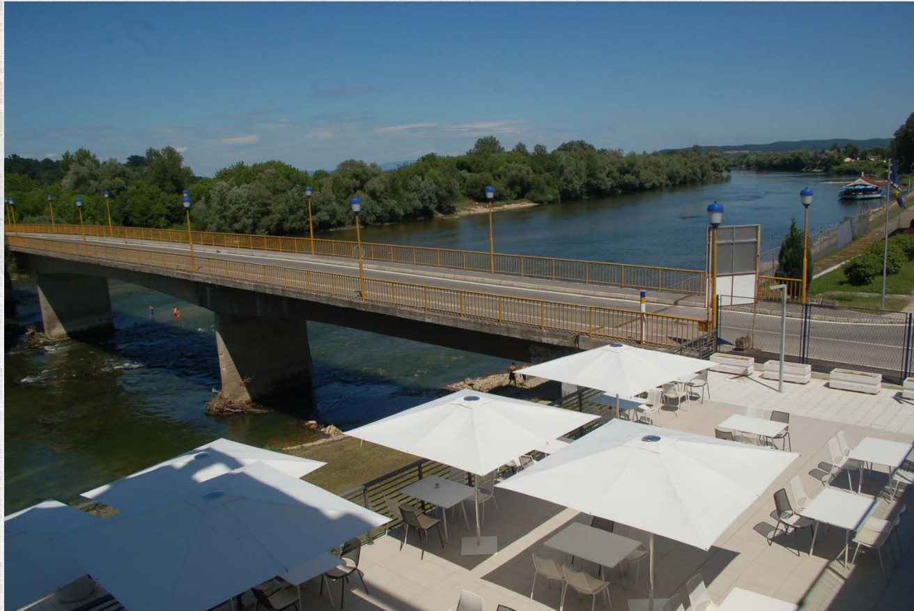
Rijeka Una - most, granični prelaz