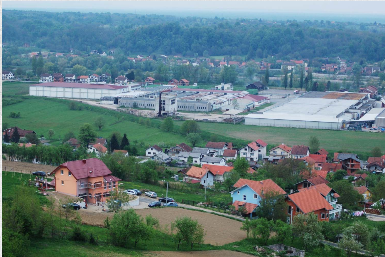
Pogled na “Unaplod” i “Dubicotton”