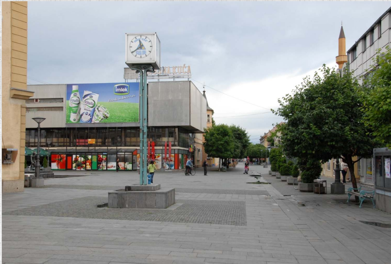
Pogled na šetalište