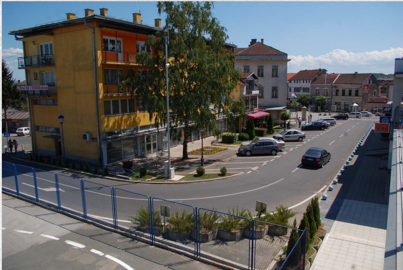
Detalj iz centra