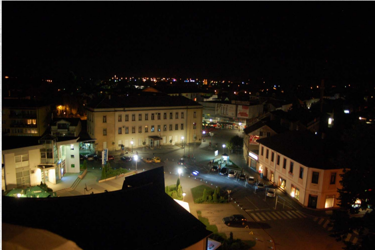
Centar Kozarske Dubice

POLOŽAJ - POGODNOSTI - POTENCIJAL - POUZDANOST - PRIVLAČNOST