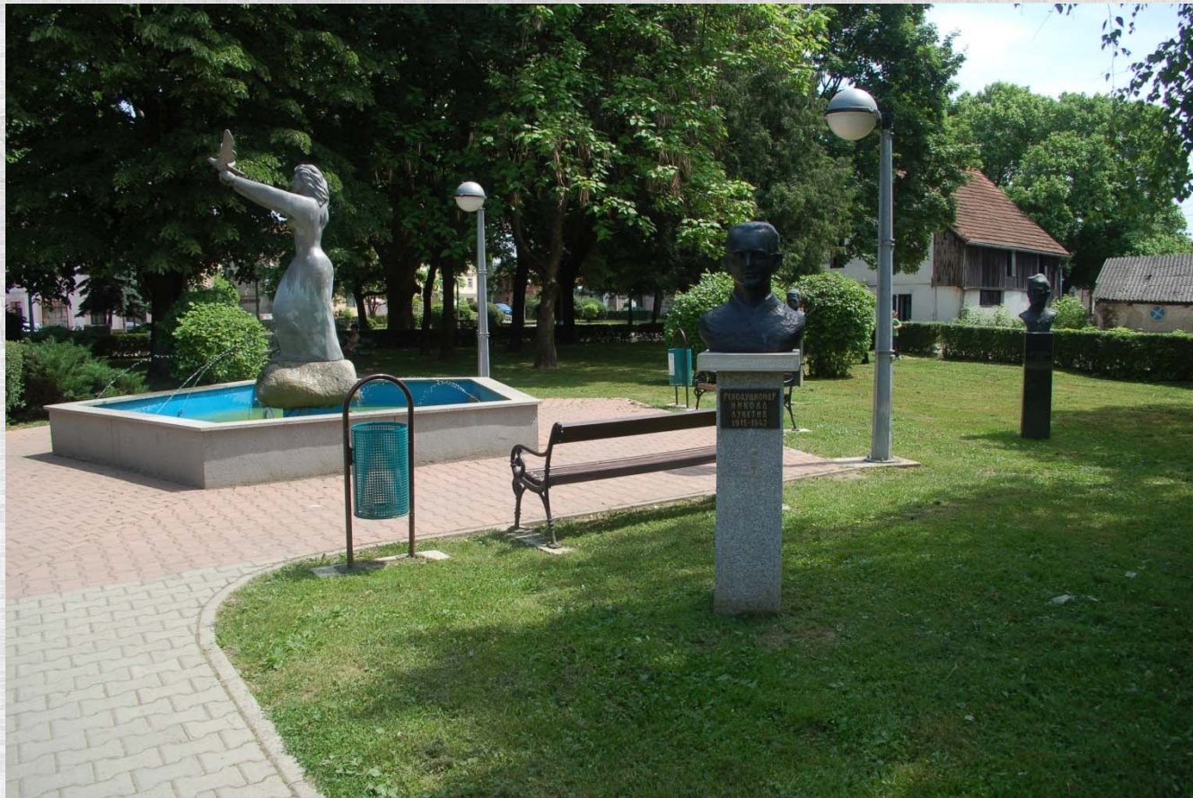
Detalj iz Gradskog parka