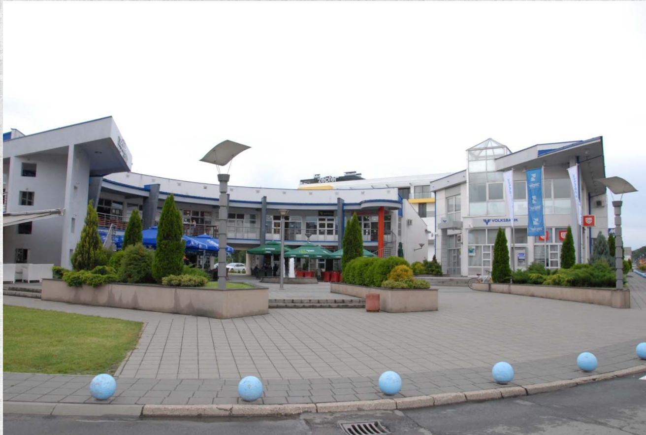
Tržni centar Zepter Plato