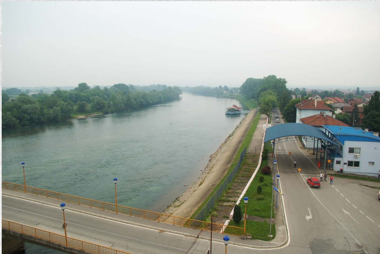
Pogled na Unu i gradski granični prelaz