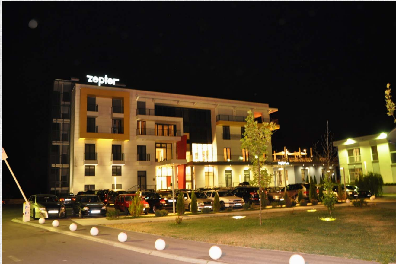
Zepter Hotel - noću

POLOŽAJ - POGODNOSTI - POTENCIJAL - POUZDANOST - PRIVLAČNOST