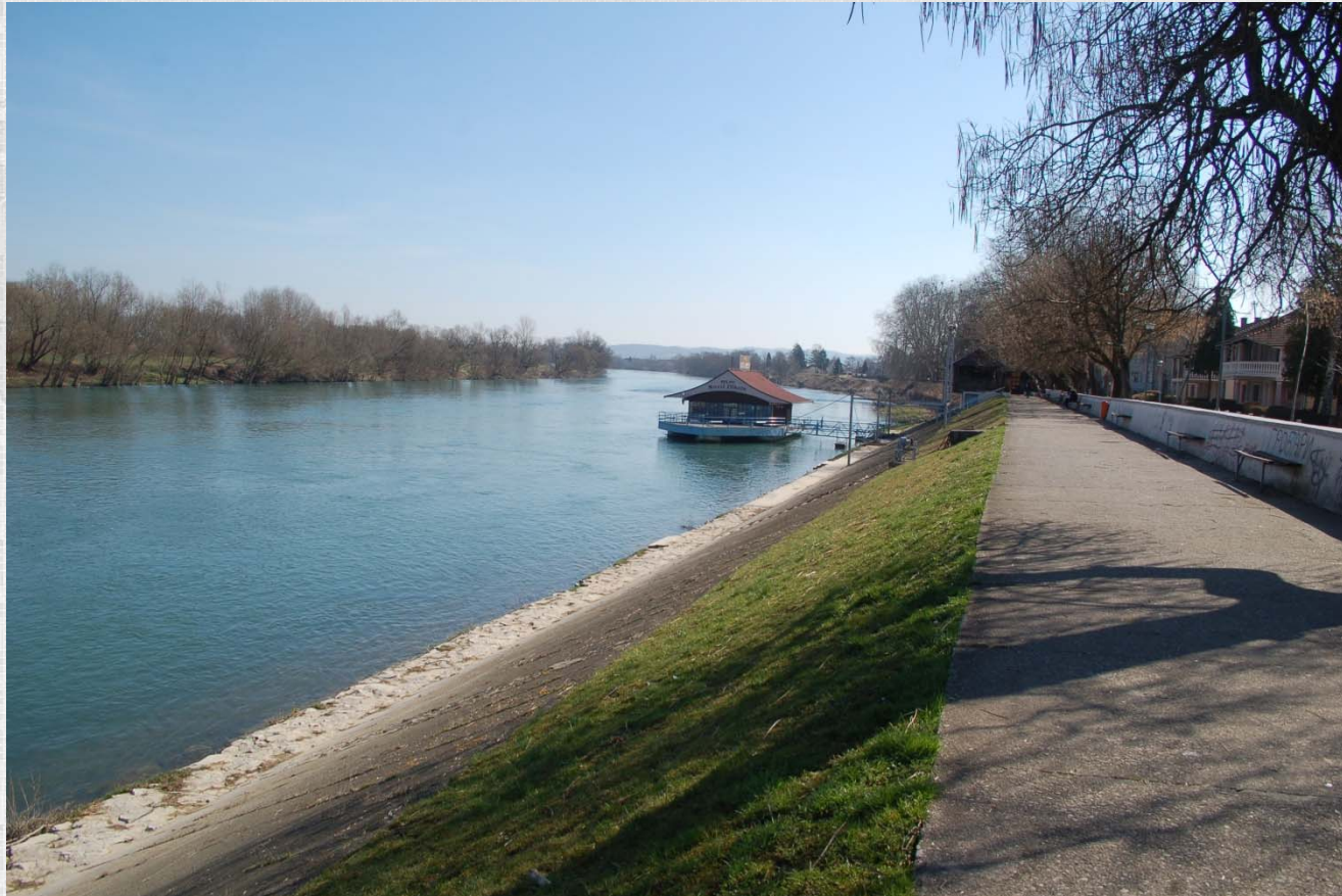
Rijeka Una, šetalište, kej