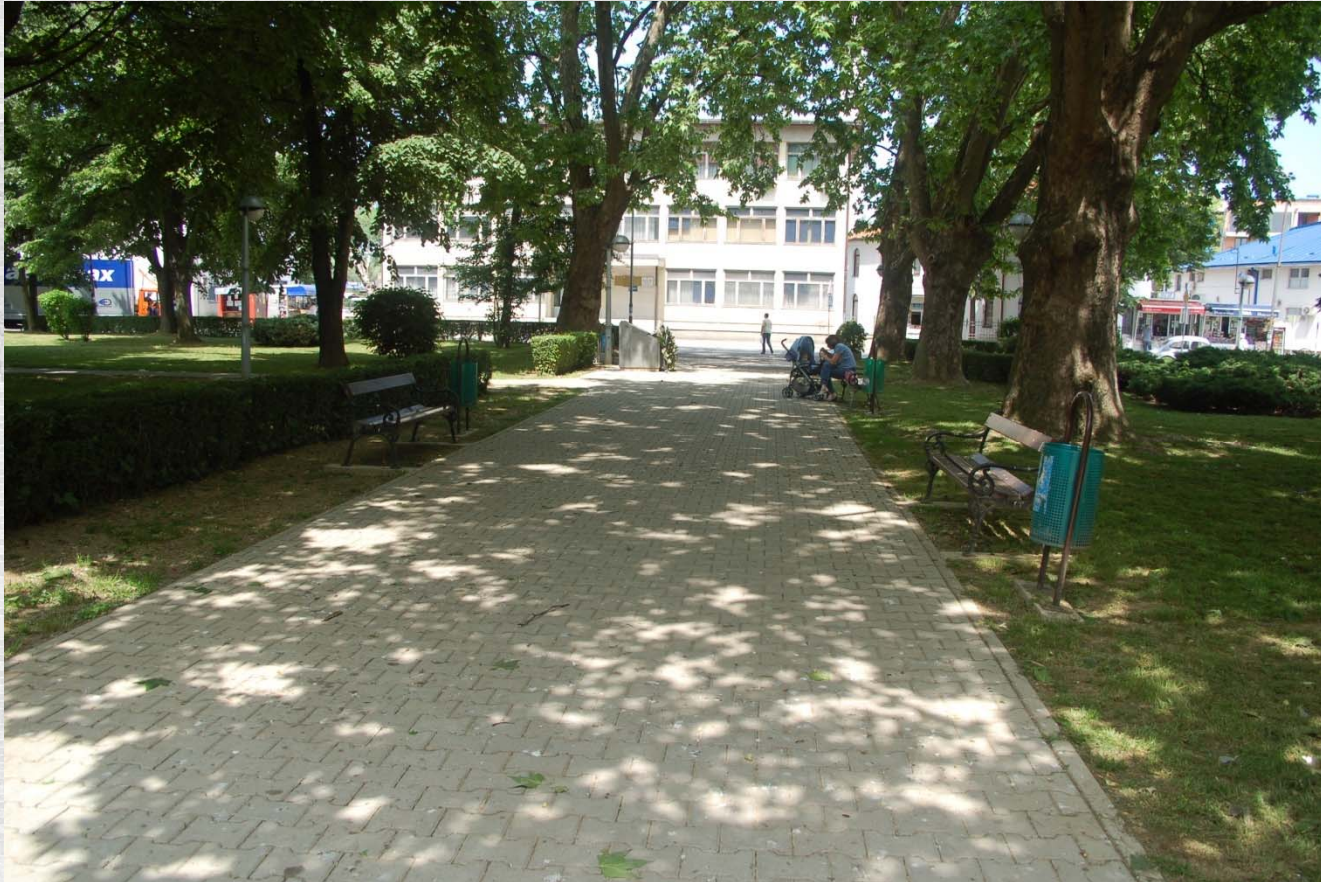
Detalj iz Gradskog parka