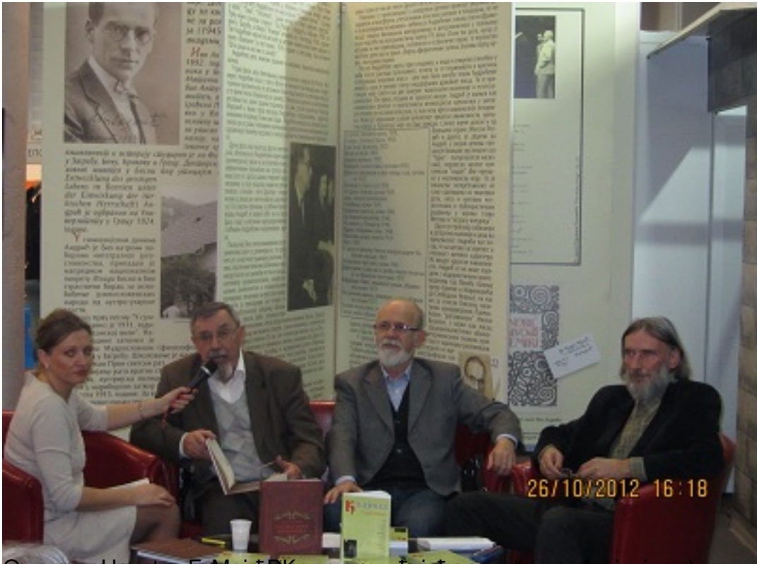
Београд, 26. Октомбра 2012. године. Представљање књиге „Срби у Јасеновцу“ аутора Драгољуба Јовановића, у издању „Београдске издавачке куће“.