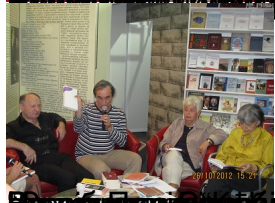
Београд, Србија, 26. Октобра 2012. Министарство просвете и културе Републике Српске