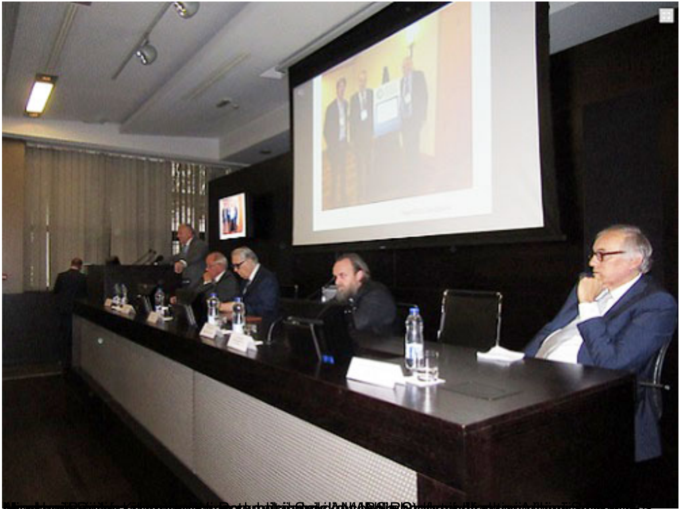
Prva dva toma Enciklopedije Republike Srpske predstavljena u Beogradu