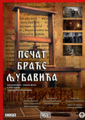
Печат брате љубавића