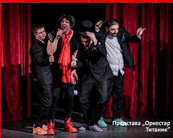
Представа „Оркестар Титаник“