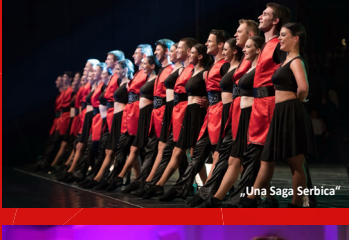
„Una Saga Serbica“