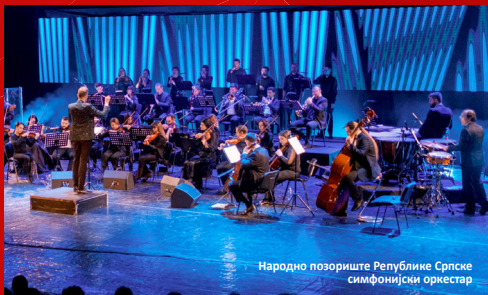
Народно позориште Републике Српске симфонијски оркестар