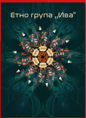
Етно група „Ива“