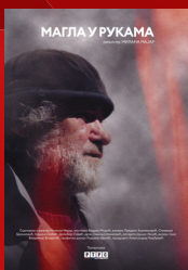
МАГЛА У РУКАМА