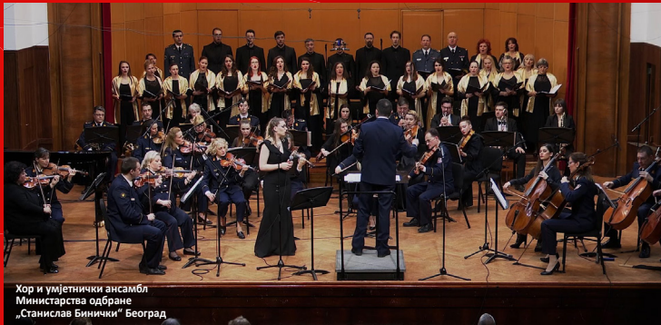
Хор и уметнички ансамбл Министарства одбране „Станислав Бинички“ Београд