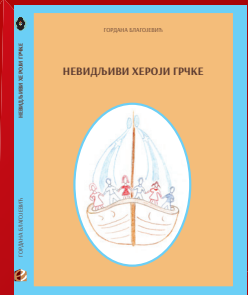
НЕВИДЉИВИ ХЕРОИ ГРЧКЕ