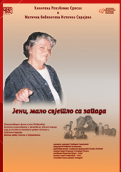
Јеци, мало сујешло са зебага