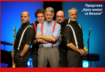
Представа „Кроз живот са Вељом“