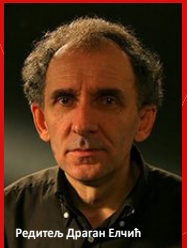
Редитељ Драгана Елчић