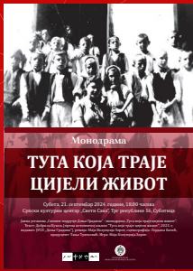
Монодрама ТУГА КОЈА ТРАЈЕ ЦИЈЕЛИ ЖИВОТ

Представништво Републике Српске у Србији Булевар деспота Стефана 4/IV, Београд Тел/факс 011 324 6633, 323 8633 www.predstavnivorsbg.rs