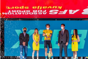
Група људи на сцени пред плакатом АФС уочи завршетка трке