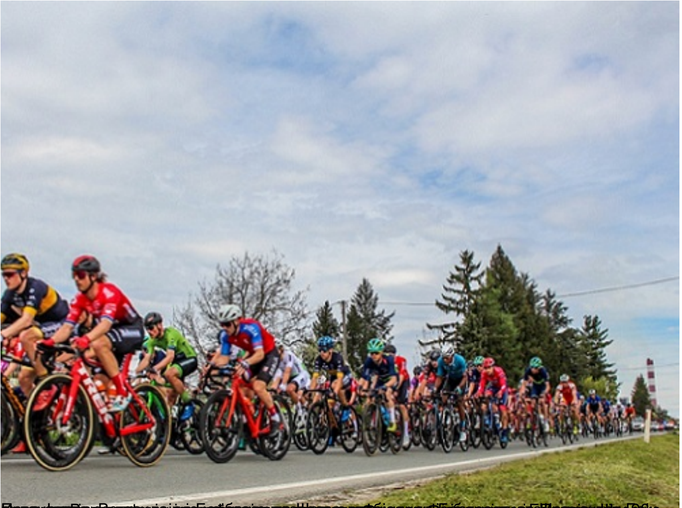
Београд – Бана Лука, 1. део трке, промена док обједује београдске банде на крају трке